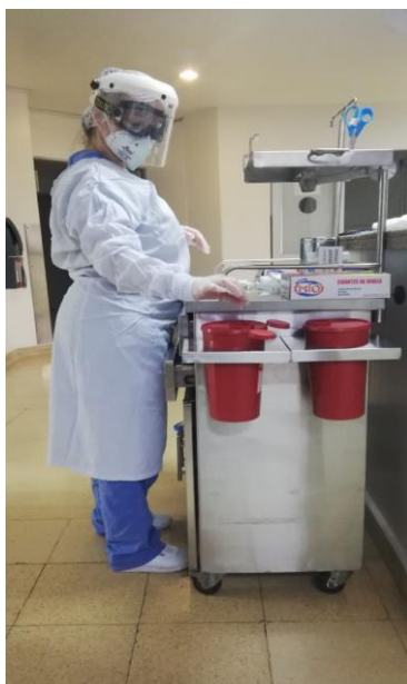
Figura 3. Capacitación en uso adecuado de EPP.

Adicionalmente, gracias a que además de ser practicante, desempeñaba funciones laborales en la Clínica Antioquia, fue posible realizar 2 actividades presenciales para reforzar lo abordado de manera virtual. En este sentido, se desarrollaron ejercicios prácticos relacionados con: uso adecuado de EPP, así como el descarte y desecho de elementos cortopunzantes y agujas.