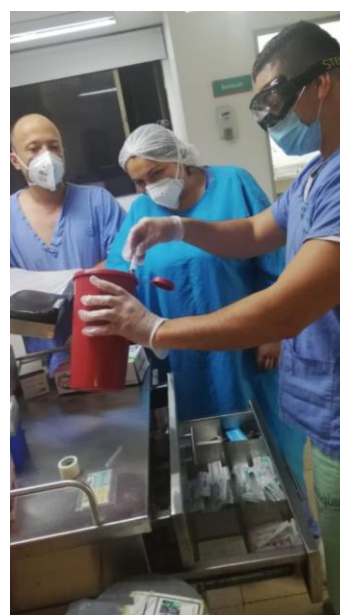
Figura 4. Capacitación en descarte y desecho de elementos cortopunzantes.