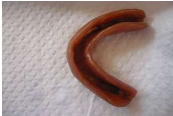
Imágenes San Luis