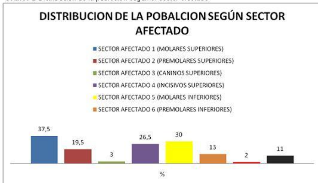
Gráfico 2 Distribución de la población según el sector afectado

El sector más afectado correspondió a Sector 1 con 37.5% (n=75), seguido del sector 5 con 30% (n=60), el sector 4 con un 26,5% (n=53), el sector 2 se afectó en un 19,5% (n=39), el sector 6 en 13% (n=26), Sector 8 con un 11%(n=22) los dientes que se afectaron en una menor proporción fueron; el Sector 3 y sector 7 con 3 % (n=6) y 2% (n=4) respectivamente.