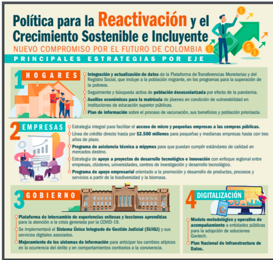
Ilustración 1, Política para la Reactivación Y el Crecimiento Sostenible