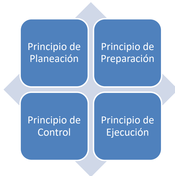
Ilustración 4, Principios Básicos de Tylor

Unidos; se le obligo a defender sus ideas ante un grupo de congresistas, la mayoría de ellos hostiles debido a que creían, junto con los líderes de los trabajadores, que las ideas de Taylor conducirían a un exceso de trabajo y al despido de trabajadores. Taylor fundamento su filosofía en cuatro principios básicos. Se observará que estos preceptos no se encuentran muy alejados de las creencias fundamentales del moderno administrador. Es cierto que algunas de las técnicas de Taylor y sus colegas y seguidores se desarrollaron con el fin de poner en práctica su filosofía y principios que tienen ciertos aspectos mecanicistas: