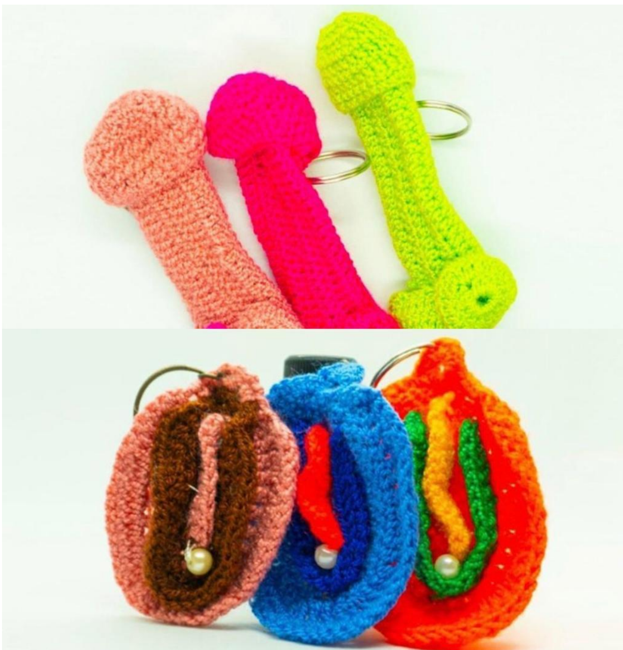
Figura 5. Foto tomada de los llaveros que ellas hacen y comercializan en sus intervenciones, las cuales hacen alusión al género femenino y masculino con los cuales ellas abordan el sexo naturalizándolo foto extraída de la red social Instagram.