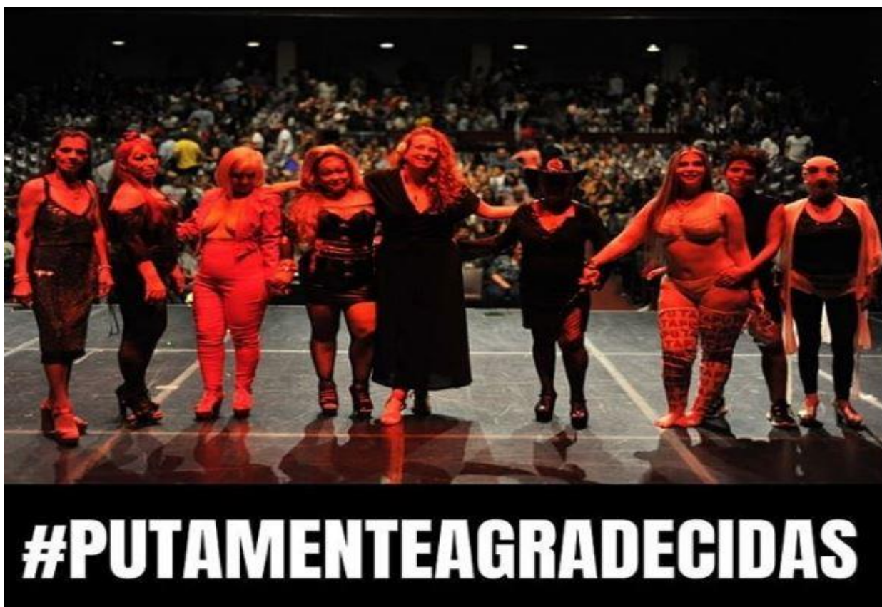
Figura 3. Foto tomada al finalizar una de sus presentaciones en el teatro pablo Tobón de Medellín. Pieza extraída del perfil de Instagram del colectivo.

En la imagen, se puede identificar en primera instancia, cómo personifican los personajes de su obra. Cabe recordar que estas piezas de teatro son readaptaciones de episodios reales de sus vidas como trabajadoras sexuales. Se evidencia además la amplitud de público asistente a este tipo de presentaciones. Aquí también se articula su Hashtag putamente , palabra con la que califican la mayoría de sus eventos y acciones. Esta se usa como referencia de su labor y a la vez, denota para ellas sinónimo de fuerza.