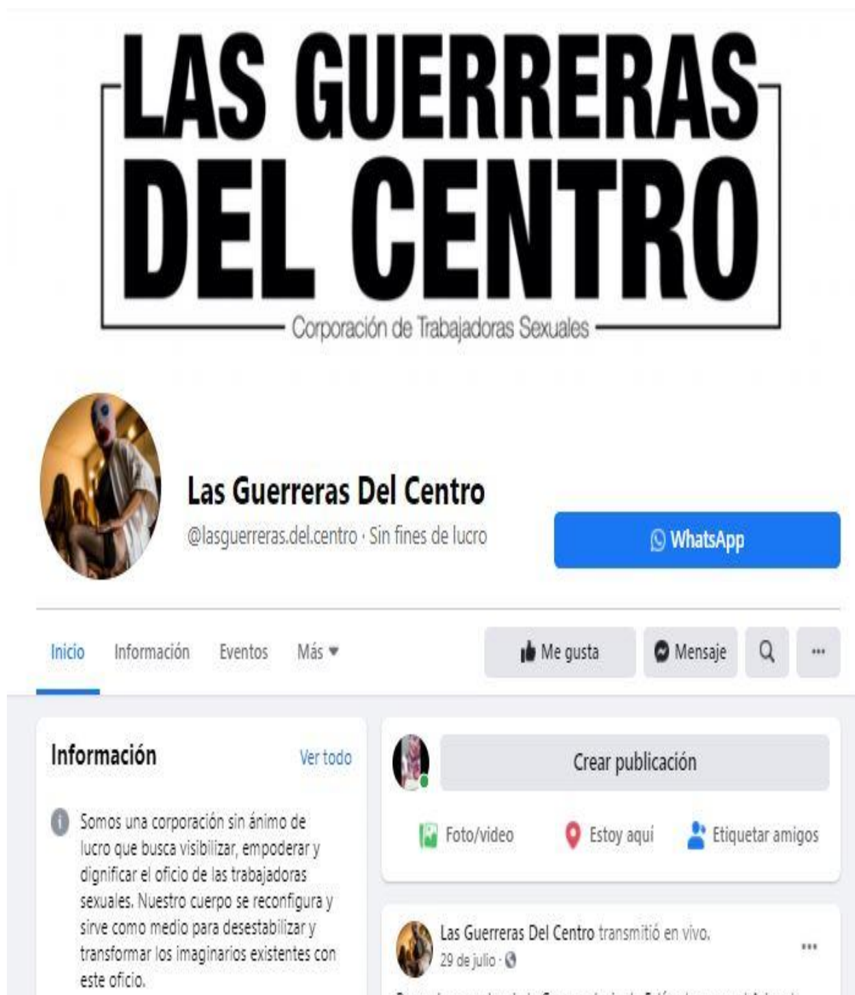
Figura 7. Red social Facebook, perfil de Las Guerreras Del Centro