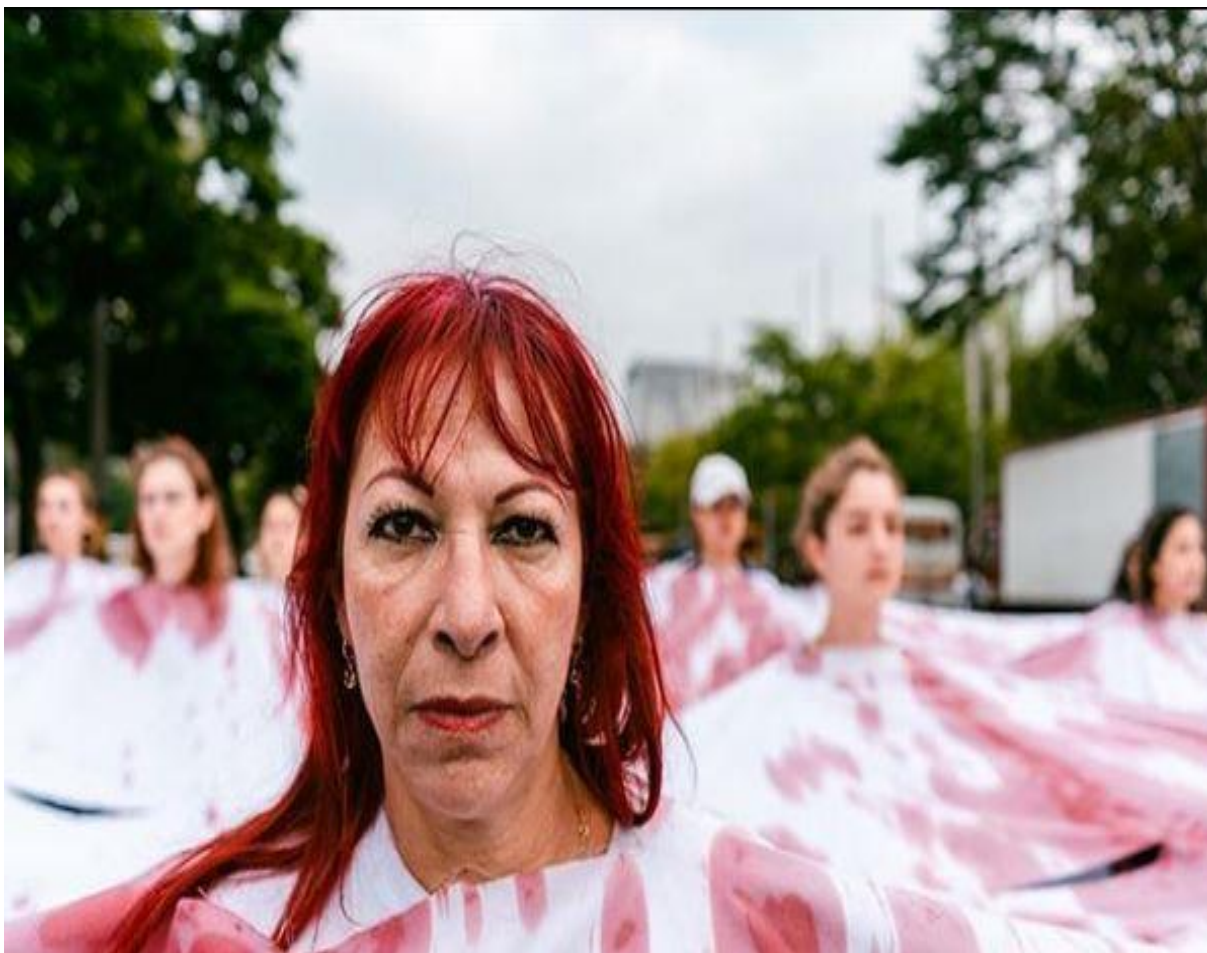
Figura 4. Captura de los rostros de las integrantes de Las Guerreras Del Centro, durante su incorporación a marchas ciudadanas en contra de los feminicidios en Medellín.

En esta imagen, se evidencia otra de las apuestas del colectivo. Se trata de las presentaciones en vías públicas. En esta ocasión, ellas se incorporaron a un movimiento externo que marcha por causas con las que estas mujeres también se sienten identificadas, como es el caso de los feminicidios. Sin embargo, ellas también son protagonistas de sus propios espacios de protestas o presentaciones en vías públicas.