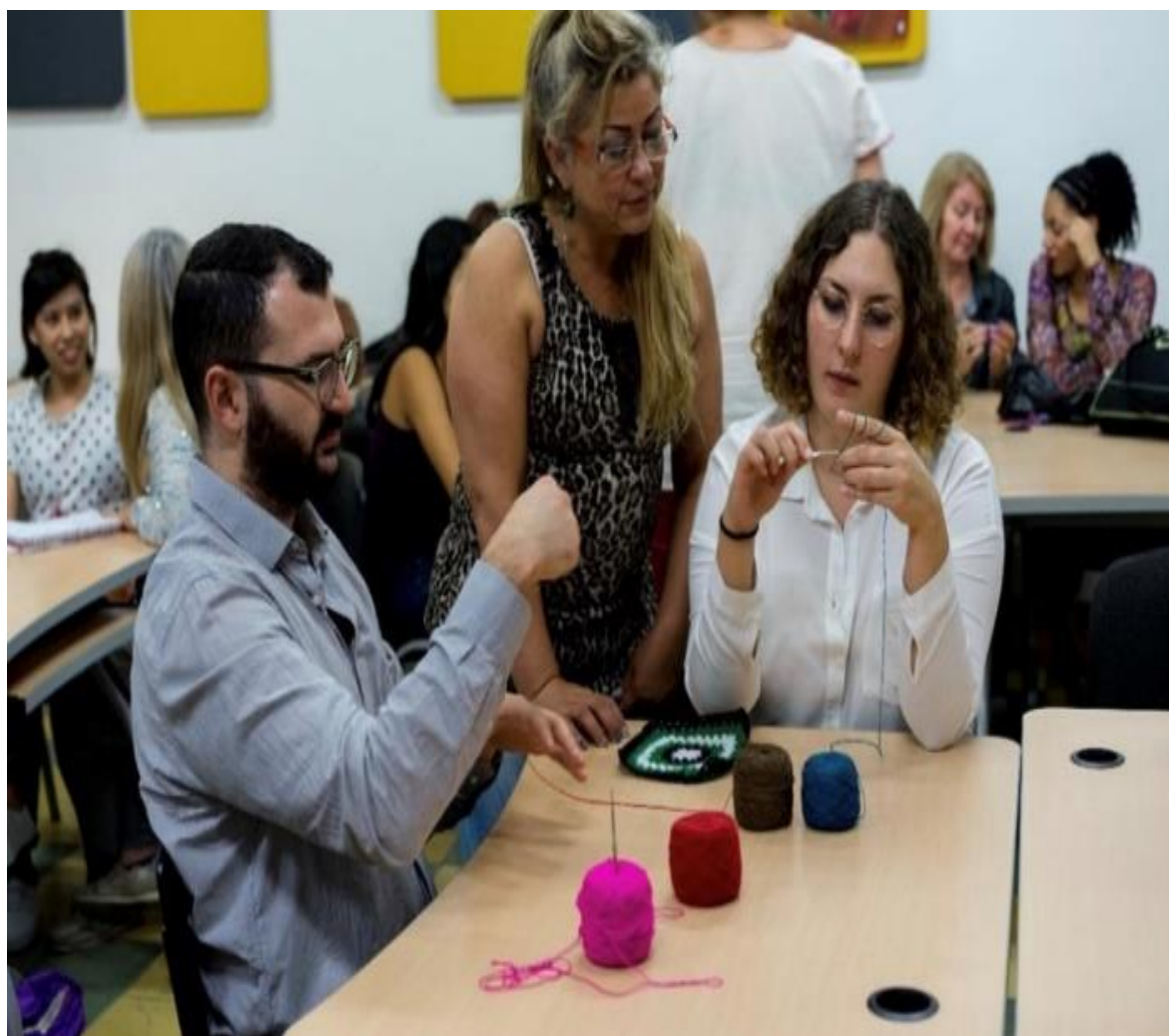
Figura 1: Foto tomada en las instalaciones del claustro de Comfama, durante su conservatorio Tejiendo Memorias .

El conversatorio Tejiendo Memorias , cuentan con un público diverso en el cual también se integran hombres, durante el proceso de elaboración de las piezas de artesanía las mujeres rotan por el auditorio explicando la manualidad e interactuando con sus seguidores.