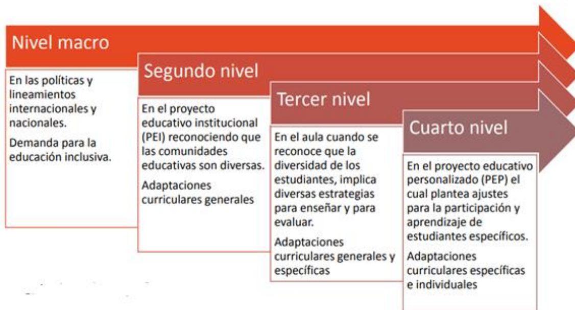
Figura 1 Niveles de flexibilización curricular

De modo que, son muchos los elementos susceptibles de cambio y que pueden ajustarse dentro del currículo con la intención de que todos los alumnos puedan ser beneficiados, tales como el horario de clases, las actividades, los materiales, el tipo de evaluación, los contenidos, la intensidad de la jornada escolar, los logros y las asignaturas. Por otra parte, Arenas & Sandoval (2013), afirman que,