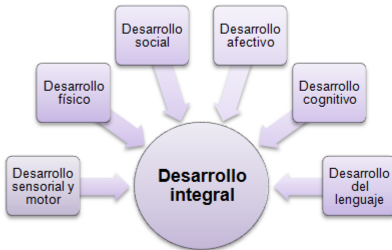
Figura 3: Autonomía y salud infantil

Estructura: en esta capacitación se pretende que los docentes y directivos sepan la importancia del desarrollo integral de los estudiantes y para esto se cuenta con todas las dimensiones del desarrollo en los niños y niñas.