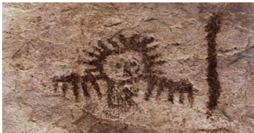
Ilustración 15. Parque Ecológico la Poma Imagen 3