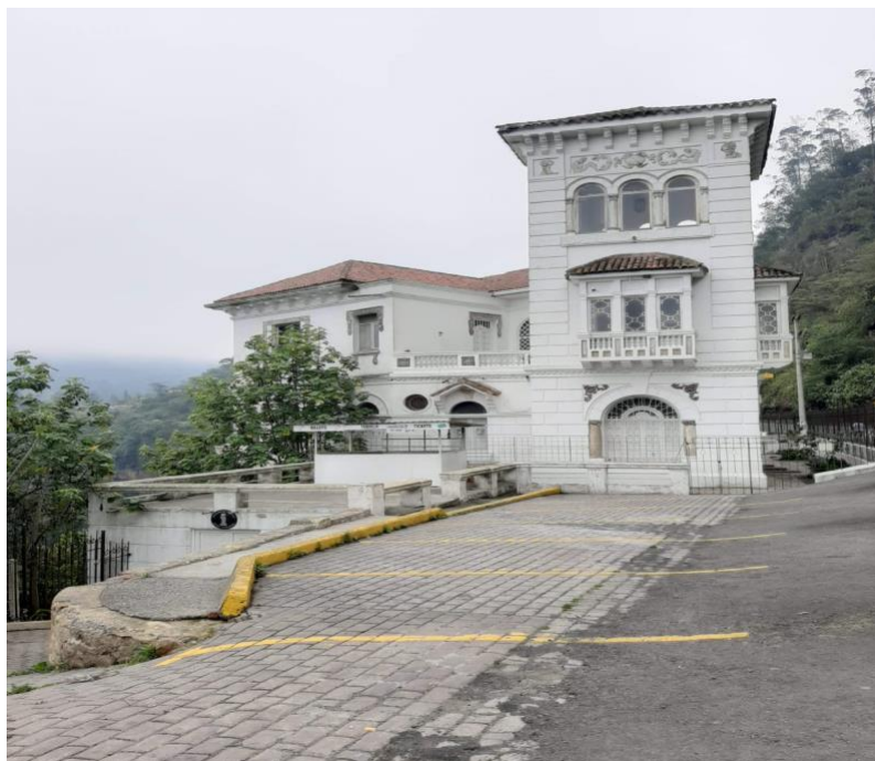
Ilustración 9. Salto del Tequendama - Imagen 1.