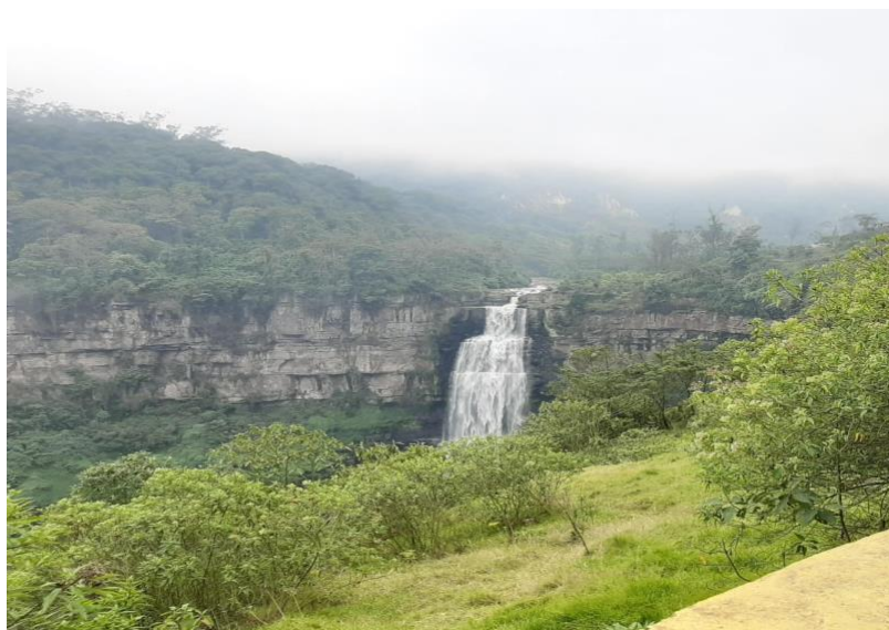
Ilustración 10. Salto del Tequendama - Imagen 2.