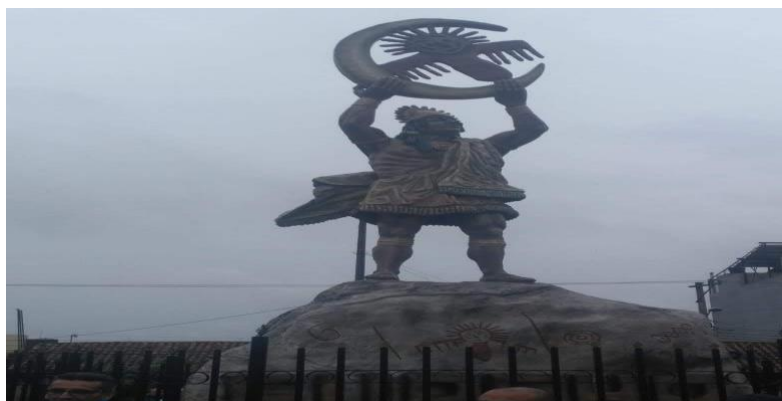
Ilustración 7. Varón del sol Soacha (Suacha) Parque principal - Imagen 1.