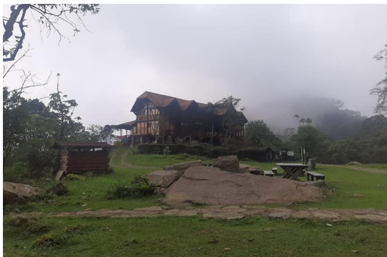
Ilustración 4. Parque ecológico Chicaque - Imagen 2.