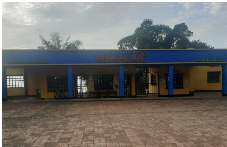
Ilustración 3. Parque ecológico Chicaque - Imagen 1.