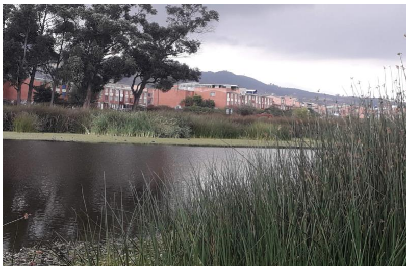
Ilustración 8. Humedal Neuta - Imagen 1.