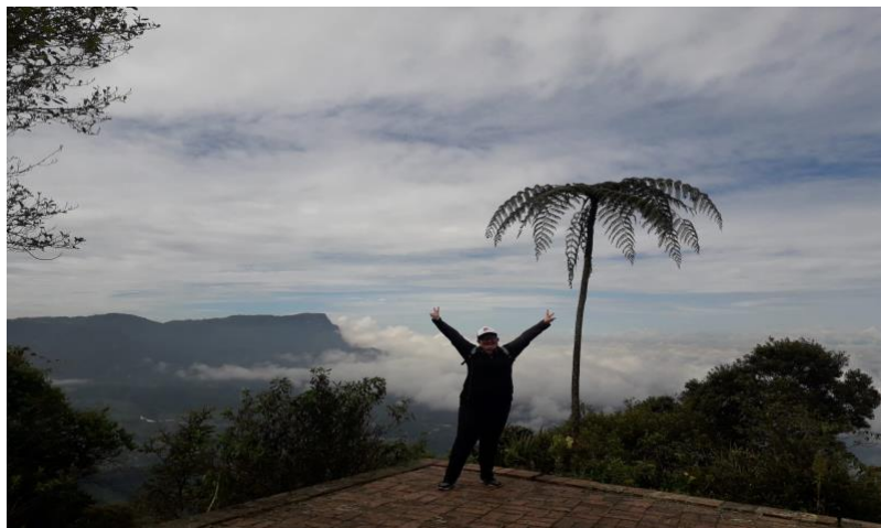
Ilustración 5. Parque ecológico Chicaque - Imagen 3.