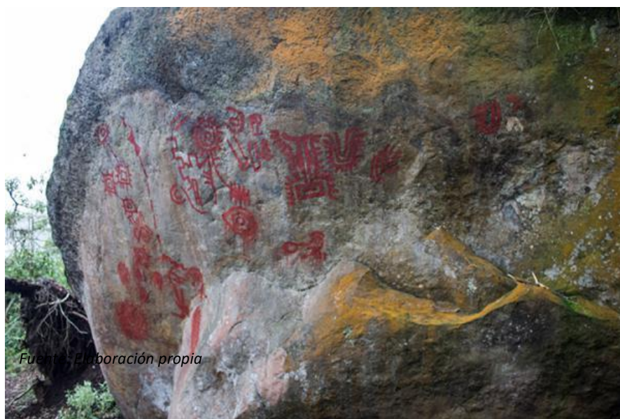
Ilustración 13. Parque Ecológico la Poma - Imagen 1.