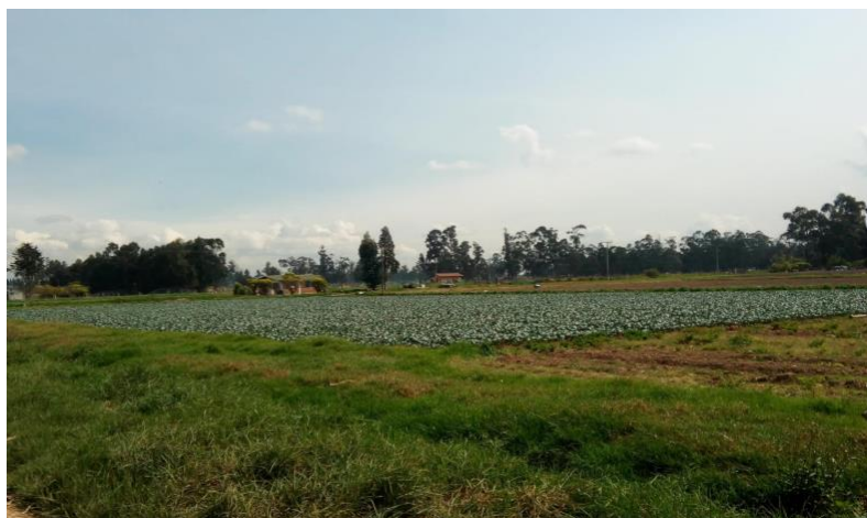
Ilustración 6. Chucua - Imagen 1.