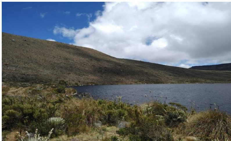
Ilustración 2. Laguna los colorados - Imagen 1.