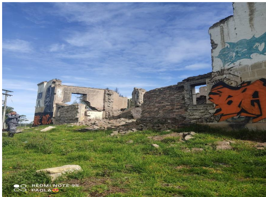
Ilustración 12. La Chucuita - Imagen 2.