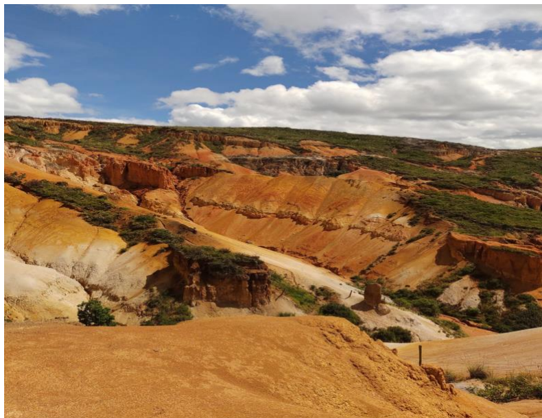
Ilustración 1. Desierto Sabrinsky - Imagen 1.