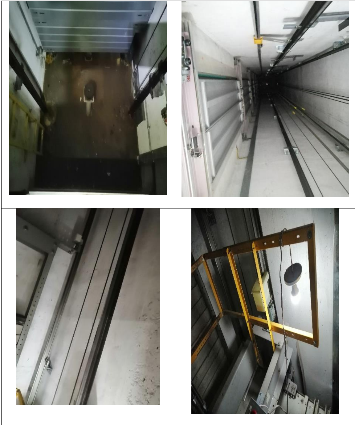
Imágen 4: Riesgo Físico (Iluminación)