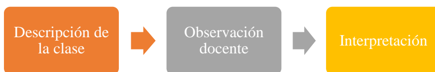
Gráfica 3: Proceso de análisis de resultados (Creación propia, 2021)

El análisis se expone siguiendo dos categorías principalmente: la observación docente y la interpretación de las situaciones ocurridas dentro de las clases.