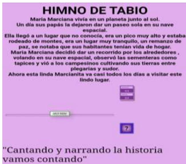
Ilustración N° 12 Evaluación: Foto ejercicio de aplicación del proyecto “cantando y narrando la Historia vamos contando”, con los estudiantes de grado 103 del Instituto Técnico Comercial José de San Martín sede Camilo Torres

Fecha: 11 de noviembre 2020