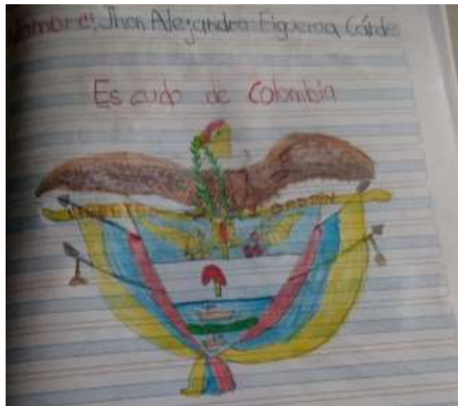
Ilustración N° 9 Escudo de Colombia: Foto ejercicio de aplicación del proyecto “cantando y narrando la Historia vamos contando”, con los estudiantes de grado 103 del Instituto Técnico Comercial José de San Martín sede Camilo Torres

Fecha: 04 de noviembre 2020