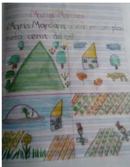
Ilustración N° 2 Himno de Tabio: Foto ejercicio de aplicación del proyecto “cantando y narrando la Historia vamos contando”, con los estudiantes de grado 103 del Instituto Técnico Comercial José de San Martín sede Camilo Torres

Fecha: 14 de octubre 2020