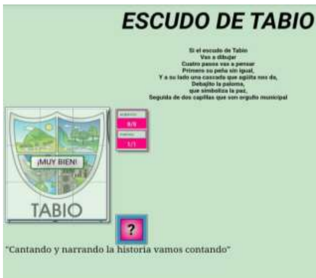
Ilustración N° 11 Evaluación: Foto ejercicio de aplicación del proyecto “cantando y narrando la Historia vamos contando”, con los estudiantes de grado 103 del Instituto Técnico Comercial José de San Martín sede Camilo Torres

Fecha: 11 de noviembre 2020