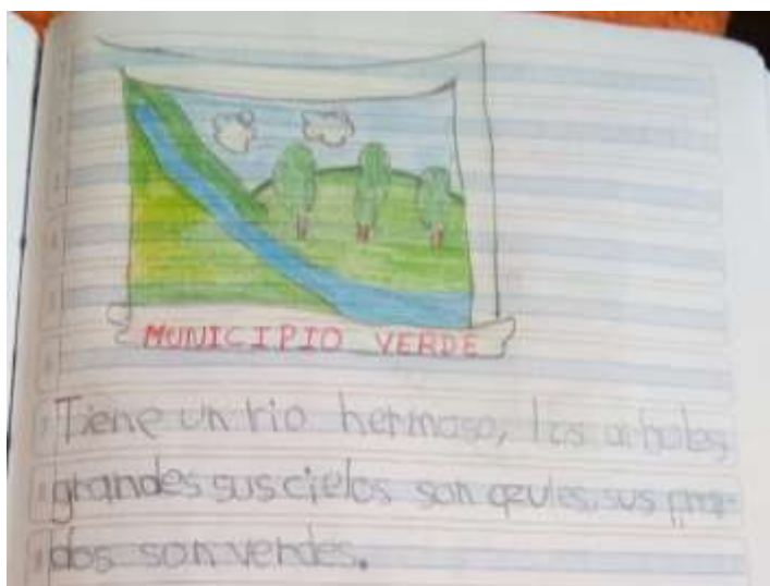
Ilustración N° 4 Escudo de Tabio: Foto ejercicio de aplicación del proyecto “cantando y narrando la Historia vamos contando”, con los estudiantes de grado 103 del Instituto Técnico Comercial José de San Martín sede Camilo Torres

Fecha: 21 de octubre 2020