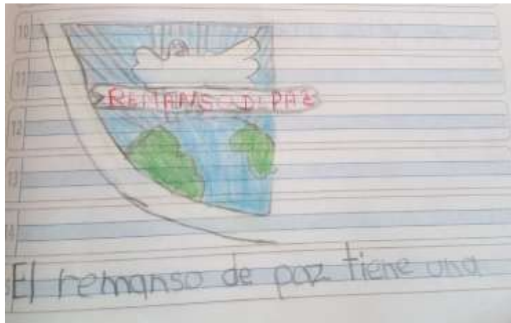
Ilustración N° 5 Escudo de Tabio: Foto ejercicio de aplicación del proyecto “cantando y narrando la Historia vamos contando”, con los estudiantes de grado 103 del Instituto Técnico Comercial José de San Martín sede Camilo Torres

Fecha: 21 de octubre 2020