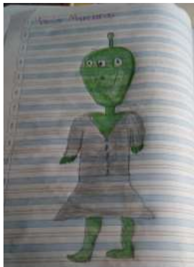
Ilustración N° 1 Himno de Tabio: Foto ejercicio de aplicación del proyecto “cantando y narrando la Historia vamos contando”, con los estudiantes de grado 103 del Instituto Técnico Comercial José de San Martín sede Camilo Torres

Fecha: 14 de octubre 2020