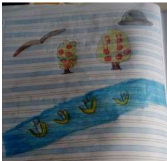
Ilustración N° 10 Escudo de Colombia: Foto ejercicio de aplicación del proyecto “cantando y narrando la Historia vamos contando”, con los estudiantes de grado 103 del Instituto Técnico Comercial José de San Martín sede Camilo Torres

Fecha: 04 de noviembre 2020