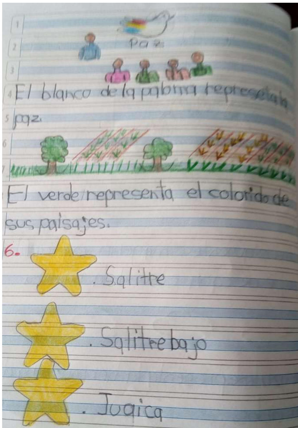
Ilustración N° 8 Bandera de Tabio: Foto ejercicio de aplicación del proyecto “cantando y narrando la Historia vamos contando”, con los estudiantes de grado 103 del Instituto Técnico Comercial José de San Martín sede Camilo Torres

Fecha: 28 de octubre 2020