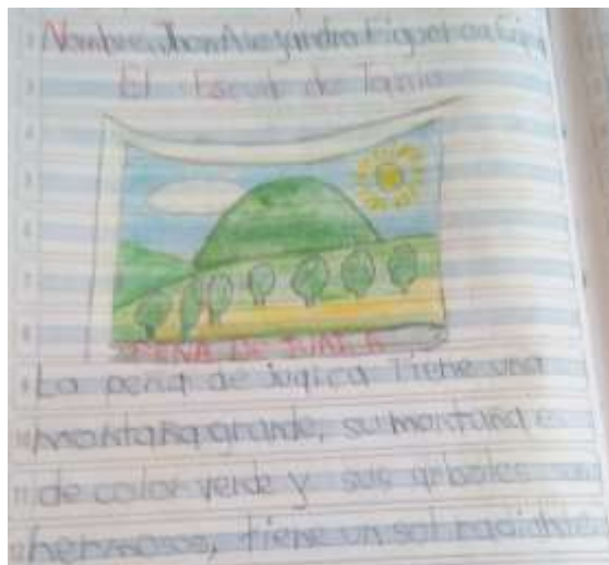
Ilustración N° 3 Escudo de Tabio: Foto ejercicio de aplicación del proyecto “cantando y narrando la Historia vamos contando”, con los estudiantes de grado 103 del Instituto Técnico Comercial José de San Martín sede Camilo Torres

Fecha: 21 de octubre 2020