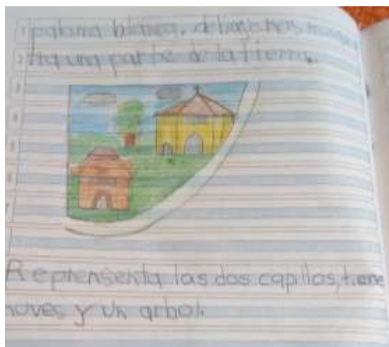
Ilustración N° 6 Escudo de Tabio: Foto ejercicio de aplicación del proyecto “cantando y narrando la Historia vamos contando”, con los estudiantes de grado 103 del Instituto Técnico Comercial José de San Martín sede Camilo Torres

Fecha: 21 de octubre 2020