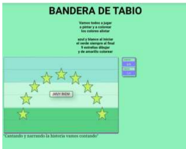
Ilustración N° 14 Evaluación: Foto ejercicio de aplicación del proyecto “cantando y narrando la Historia vamos contando”, con los estudiantes de grado 103 del Instituto Técnico Comercial José de San Martín sede Camilo Torres

Fecha: 11 de noviembre 2020