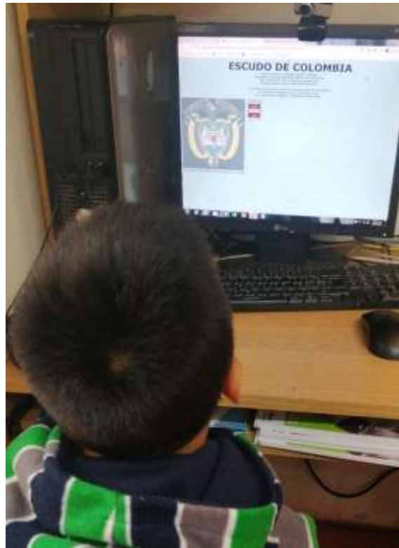
Ilustración N° 15 Evaluación: Foto ejercicio de aplicación del proyecto “cantando y narrando la Historia vamos contando”, con los estudiantes de grado 103 del Instituto Técnico Comercial José de San Martín sede Camilo Torres

Fecha: 11 de noviembre 2020