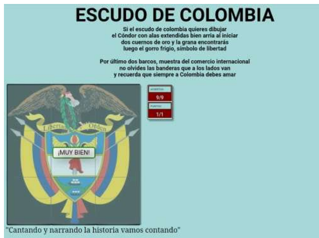
Ilustración N° 13 Evaluación: Foto ejercicio de aplicación del proyecto “cantando y narrando la Historia vamos contando”, con los estudiantes de grado 103 del Instituto Técnico Comercial José de San Martín sede Camilo Torres

Fecha: 11 de noviembre 2020