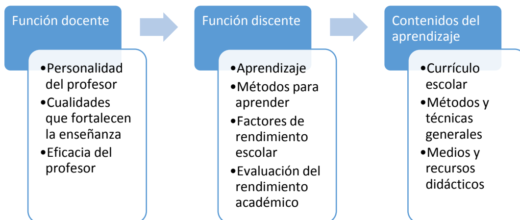
Gráfica 2: Aspectos de los que se ocupa la didáctica (construcción)