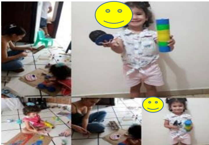
Figura 5: fotografía indicaciones de Personaje de la semana