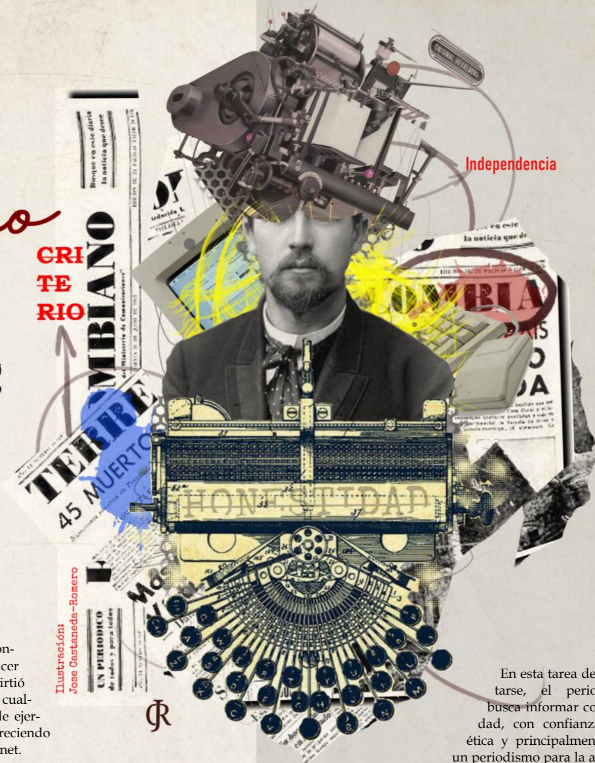
Ilustración: Jose Castañeda-Romero

En esta tarea de adaptarse, el periodismo busca informar con calidad, con confianza, con ética y principalmente ser, un periodismo para la audiencia, con el cual ahora todos pueden crear contenidos.