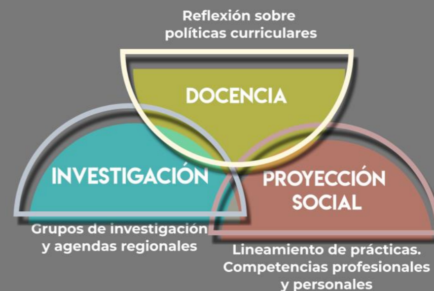
Gráfico 1: Aportes del Proyecto a las funciones sustantivas.

La participación en el proyecto, resalta la apuesta del programa por un mejoramiento continuo, más aun teniendo en cuenta el impacto del mismo en las tres funciones sustantivas: docencia, investigación y proyección social, como se evidencia en el Gráfico 1 y que se desarrolla en detalle a continuación: