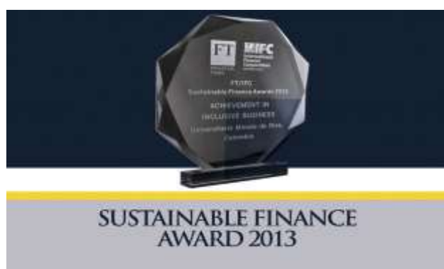
Ilustración 1 Premio sustainable finance award 2013