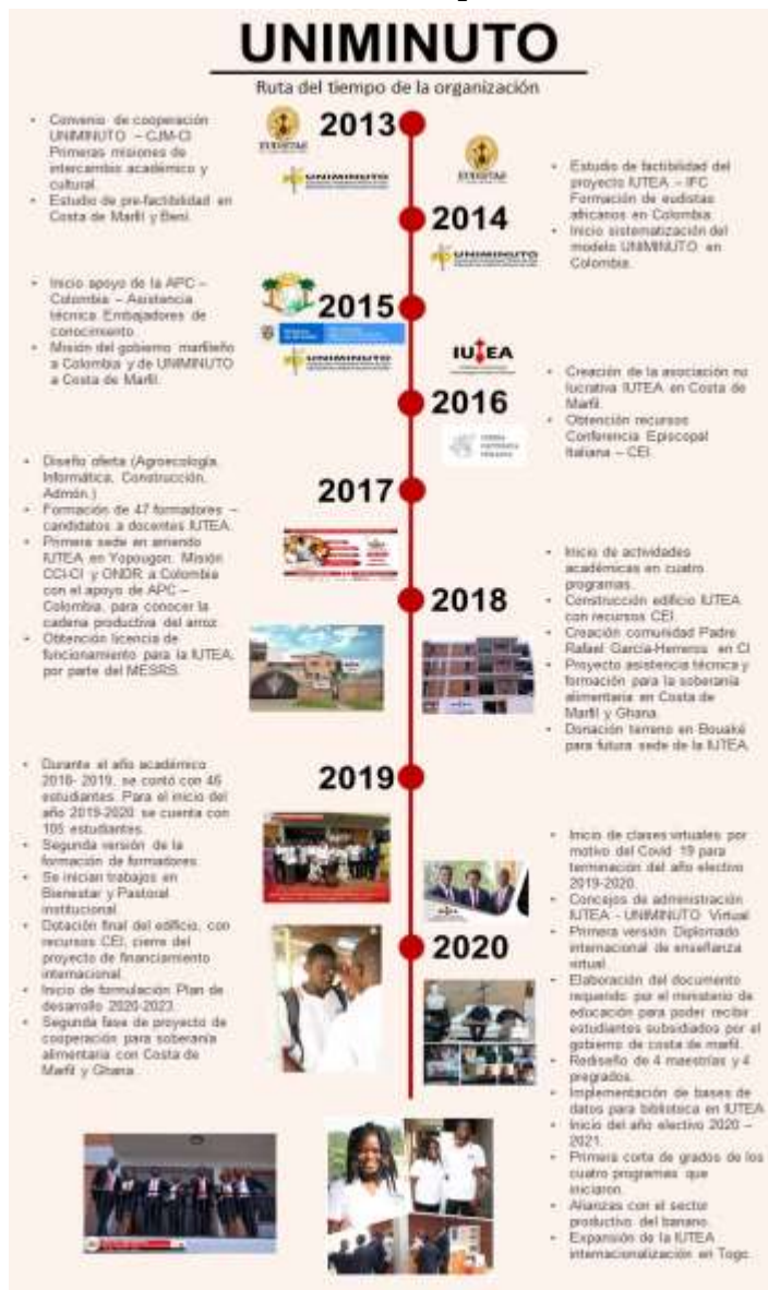
Fuente: Gallego, Jorge, (2019), COOPERACION SUR - SUR y Triangular Proyección social internacional de UNIMINUTO