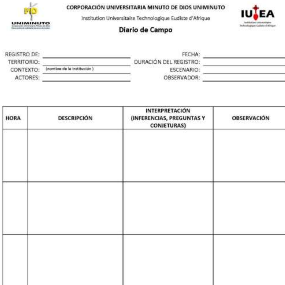
Ilustración 4 Formato diario de campo

El siguiente formato presenta la estructura del diario de campo que se llevará a partir de las observaciones participantes que se dan en el proceso investigativo.