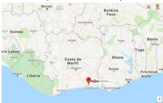
Ilustración 3 Continente: África / País: Costa de Marfil / Ciudad: Abiyán / Comuna: Yopougon

Con el fin de reconocer el territorio en el cual se lleva el proceso de replicabilidad del modelo pedagógico a esta cultura, a continuación, se señalan algunos rasgos que llevan a la comprensión geográfica de Costa de Marfil.