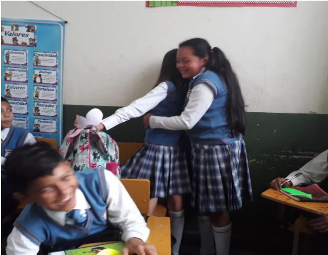
Foto: Implementación de Estrategias de Juego y Didáctica.