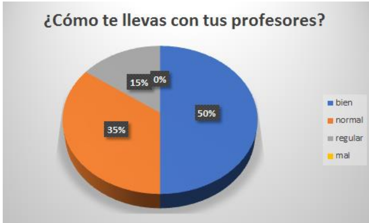
Gráfico cuarta pregunta