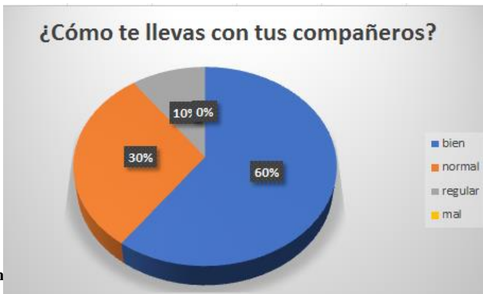
Gráfico tercera pregunta

conoce y han sido informadas practicando así la mayoría de las reglas básicas de convivencia contempladas en el reglamento estudiantil dando un sentido de pertenencia y responsabilidad con su escuela.