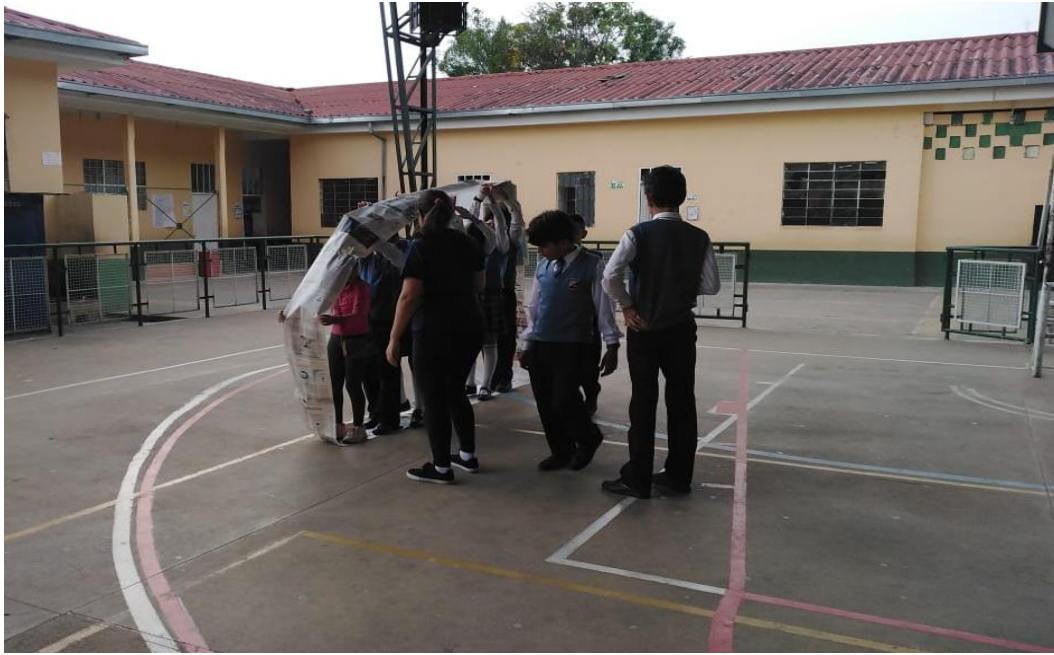
Foto: Implementación de Estrategias de Juego y Didáctica.