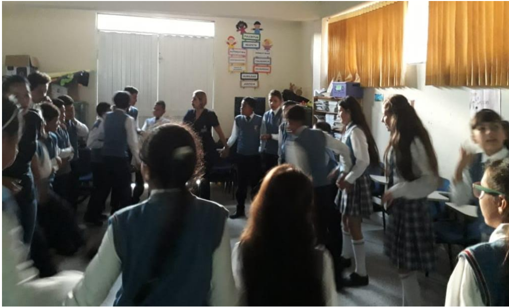
Foto: Implementación de Estrategias de Juego y Didáctica.