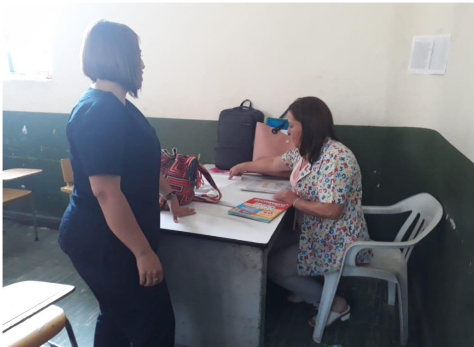
Foto: entrevista no estructurada