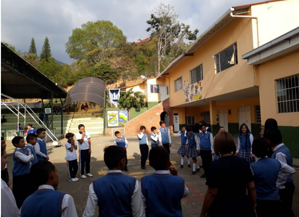
Foto: Implementación de Estrategias de Juego y Didáctica.