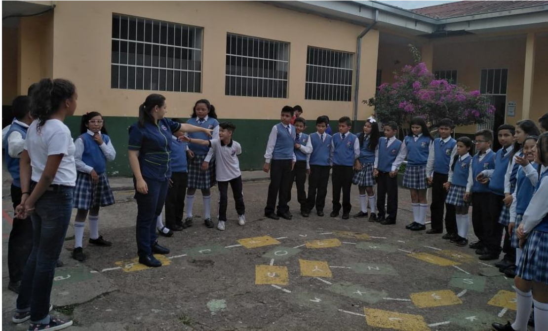
Foto: Implementación de Estrategias de Juego y Didáctica.