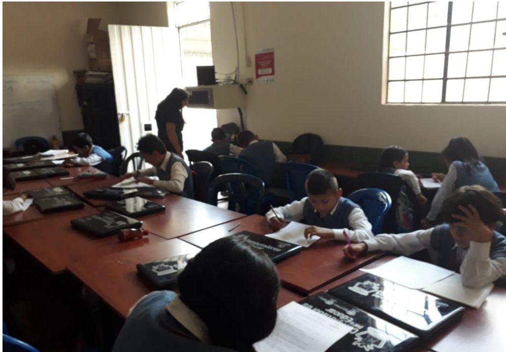
Foto: aplicación de la encuesta