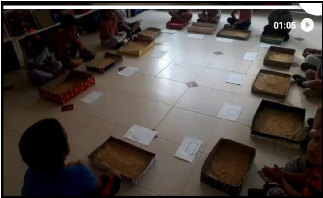
Ilustración 31. .Actividad sensorial. Betty Sabogal. El Colegio