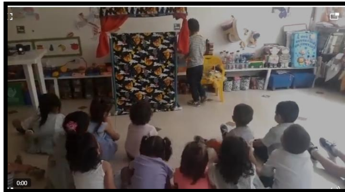
Ilustración 6. Actividad de Colegio.