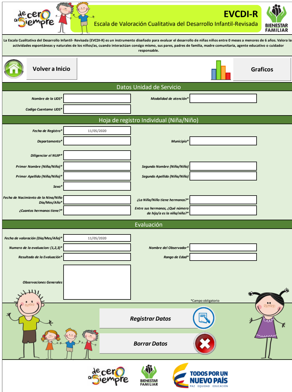
Ilustración 1.Formato de Escala de valoración. Betty Sabogal. El Colegio