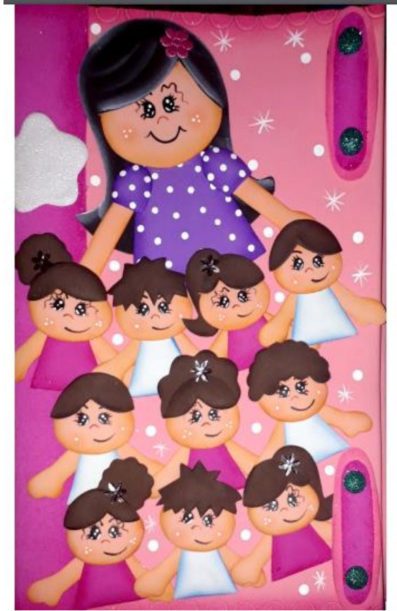
Ilustración 3. Portada diario de campo . Betty Sabogal .El Colegio