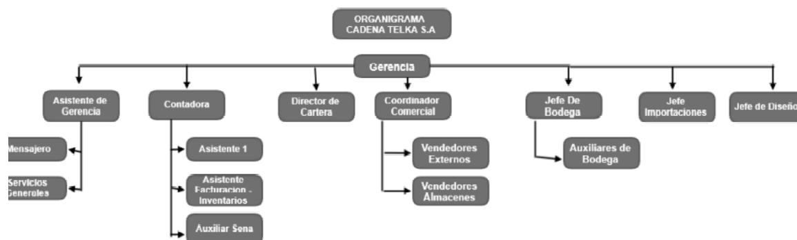
Figura 1. Organigrama de la empresa Cadena Telka S.A.S, Fuente: Elaboración propia.

En la figura 1 se presenta el organigrama de la empresa CADENA TELKA SAS, compuesta por la Gerencia General, la contadora, un departamento de contabilidad con su auxiliar contable y los asesores comerciales, en este caso la práctica se realizó en el área de Auxiliar de Facturación e Inventarios