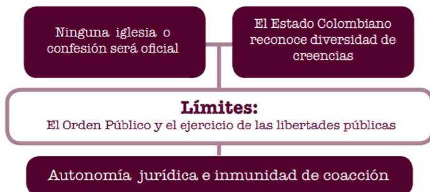
Figura 2 Directrices Jurídicas Ministerio del Interior oficina asuntos religiosos

En Colombia a todas las instituciones religiosas sin excepción alguna están obligadas a estar inscritas ante el ministerio del interior quien es la entidad encargada en regular las instituciones religiosas en Colombia y la única autorizada en otorgar la Personería Jurídica, este registro debe hacerse ante la oficina de asuntos religiosos del Ministerio del Interior esta parte del ministerio es la encargada en parte por garantizar que se cumpla el Artículo 19 de la Constitución política de Colombia que habla de la garantía de la libertad de culto y del derecho de toda persona a profesar libremente su religión (Interior M. d., 2016)