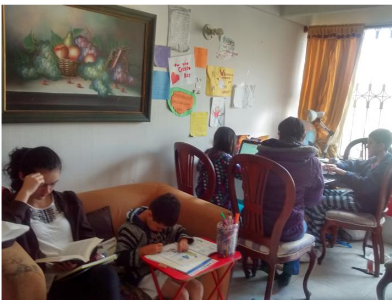
Familia Charcas jornada común de

Paulo Freire concepción educación como depositar, de transmitir conocimientos” p.79); procesos los que los niños,