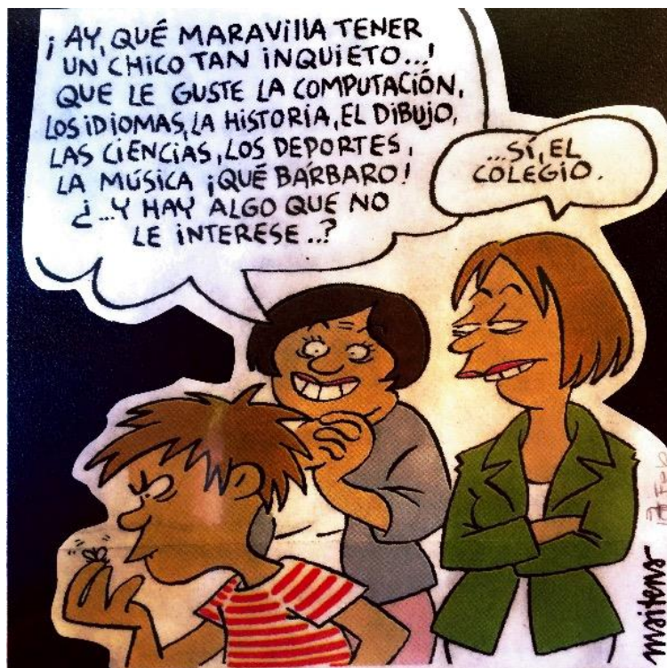
Ilustración 1: El Colegio (Burundarena, 2019)

metodológicos o baja calidad, o por razones sociales, religiosas y culturales. Para otros, el homeschooling es una opción coherente con estilos de vida alternativos.” (Semana virtual, 2014)