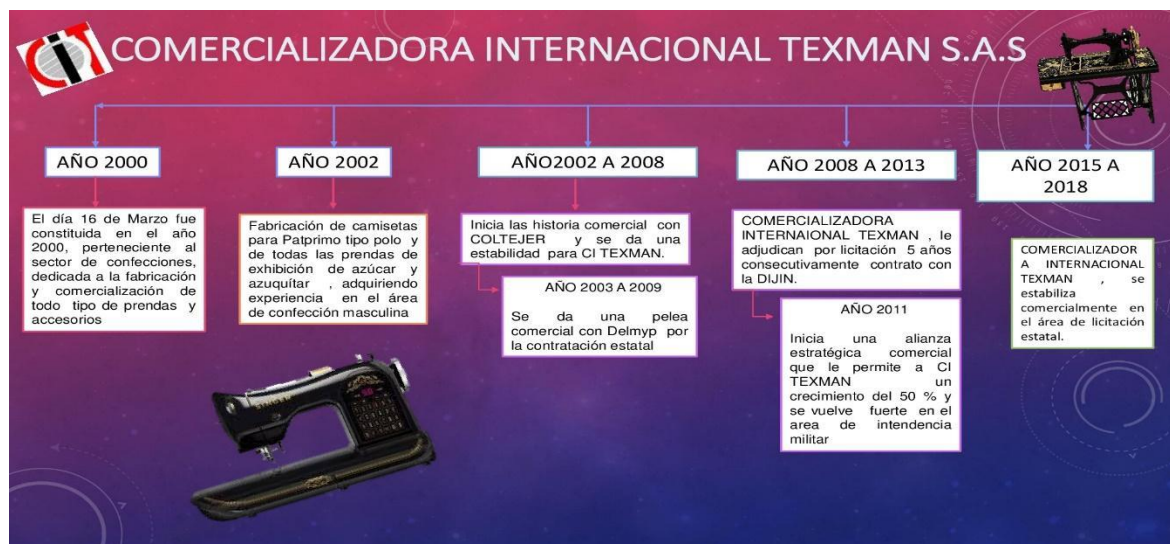
Figura 1. Línea de tiempo de la reseña histórica de CI Texman SA.