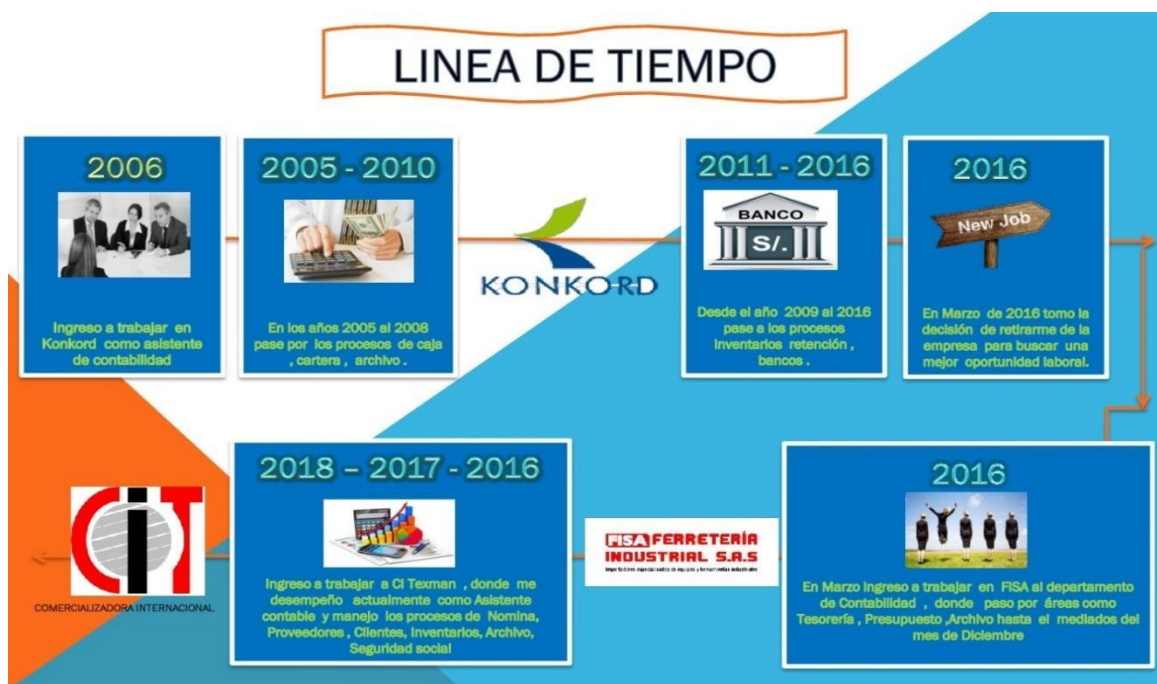
Figura 3. Línea de tiempo Áreas de Desempeño Laboral.

Reiterando las afirmaciones hechas en este capítulo, se concluye que en desarrollo o con ocasión del cumplimiento de su deber funcional y perfil en el cargo de auxiliar contable, se recorrió el camino por diferentes departamentos, en la práctica y experiencia laboral en el de contabilidad desempeñó roles en cumplimiento del deber funcional y perfil profesional, en diferentes, campos, aristas y esferas, rutas de la ciencia contable, que se fueron enriqueciendo, complementando y retroalimentando, de los conocimientos adquiridos en la academia, lo que amplió y permitió el entender cada una de ellos, y colmó la expectativa que tenía al iniciar su formación como profesional consistente en comprender la dinámica de las cuentas y su comportamiento en un estado financiero.