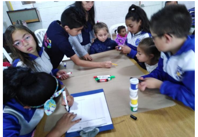
Imagen 2 & 3: Ejercicio prospectiva (anexo imagen 1) - (anexo imagen 2)