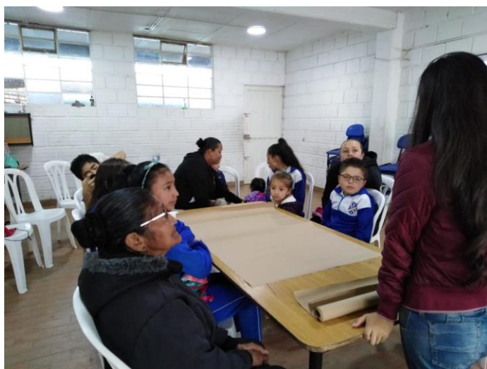
Anexo imagen 1.