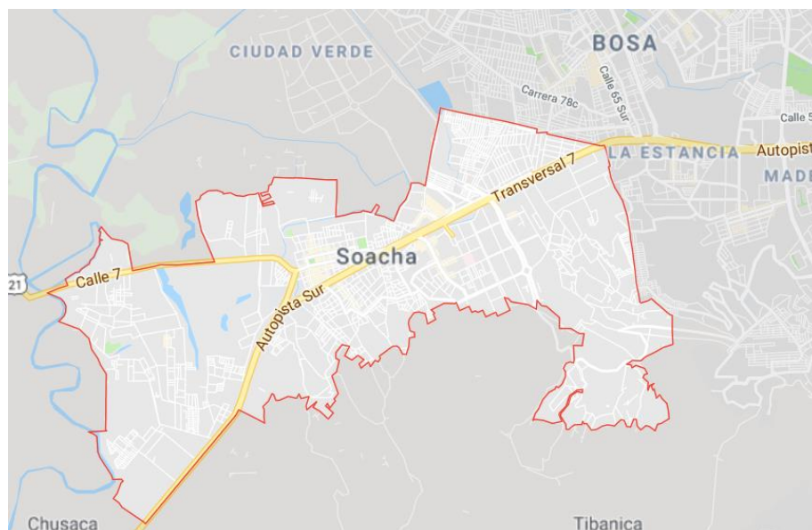
Imagen 1. Mapa del Municipio de Soacha (Google-maps, 2019)

En primera medida es necesario ubicar el municipio de Soacha como eje central debido a que en gran medida su parte territorial tiene un recorrido histórico cultural, político, social, etc., por ende, es necesario hacer una breve descripción; “El municipio de Soacha está situado sobre una estructura geológica sedimentaria de rocas plegadas que afloran por toda su parte media y alta y depósitos lacustres, fluviales y colluviales que forman su parte plana. Soacha se encuentra localizado en 4°35'03" latitud norte y 74°13'23" longitud oeste. Presenta una temperatura de 14°C y posee un área de 24 hectáreas.” (Soacha Juntos formando Ciudad, 2017)