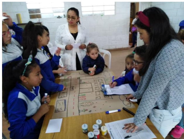
Imagen 4: Ejercicio prospectiva (anexo imagen 3)

Para esta sesión se contó con la participación de los tres actores principales, del sector público con la representación de la funcionaria de la alcaldía municipal de Soacha, del sector privado con la representación de docentes, coordinadora y directivos del Colegio Dios es Amor y del sector civil con la representación de los niños y padres de familia.