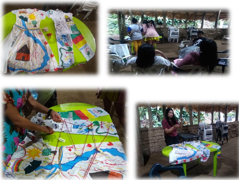
Imagen 24, 25, 26 y 27: Participación de las jóvenes en la actividad de la dualidad, con las piezas museales creadas en los anteriores laboratorios.

Fotografías de elaboración propia: imágenes que indican el desarrollo y participación colectiva de una nueva narrativa de las dualidades en el territorio.