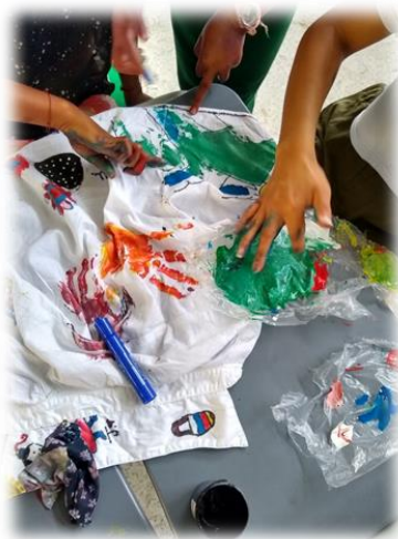
Imagen 5: realización de pieza museal, por las niñas del colegio de primaria de Chemesquemena.