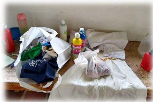
Imagen 17: Insumos para la creación de la pieza museal con los docentes en el Colegio de Guatapurí