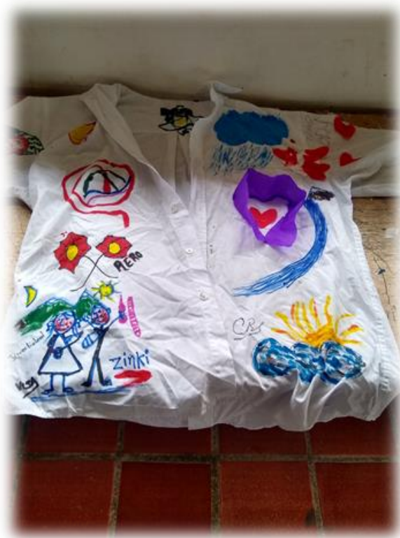
Imagen 19: creación de pieza museal (camisa) por los docentes (hombres).