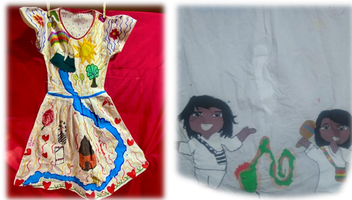
NOTA: Elaboración docentes Chemesquemena y Guatapurí

Según Carlos Huertas (2015), la dualidad es un principio fundamental en muchas culturas indígenas, donde se reconoce la coexistencia de opuestos que, lejos de ser excluyentes, se complementan. En la cosmovisión Kankuama, esta dualidad es parte del equilibrio del mundo. Huertas menciona: "El principio de la dualidad se manifiesta en las relaciones entre el hombre [y mujer] y la naturaleza, donde el entendimiento del mundo se basa en las fuerzas opuestas, pero complementarias, que deben estar en equilibrio para asegurar la armonía cósmica". Esta perspectiva puede ser vista en las fotos de las prendas, donde los colores rojos, verdes, amarillos y azules no solo son visualmente contrastantes, sino que también representan esta armonía entre opuestos. Por ejemplo, el rojo y el verde en los pantalones representan las fuerzas de la tierra y la naturaleza que se complementan, tal como Huertas describe la interacción de los elementos en el pensamiento indígena.