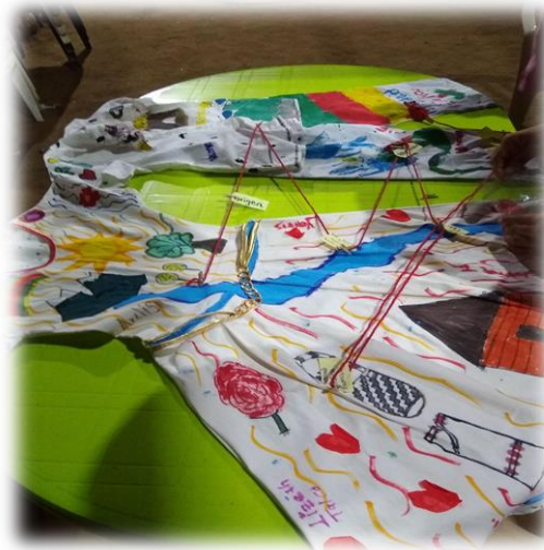
Imagen 28 y 29: Resultado de la conexión de dualidad en el territorio de Chemesquemena con las jóvenes de la comunidad en la Casa de Pensamiento.