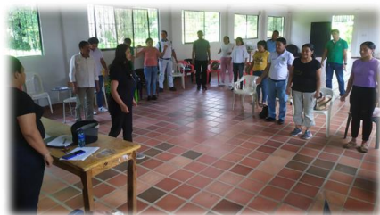
Imagen 6,7 y 8: Encuentro con los docentes en el Colegio de Guatapurí sede Bachillerato. Elaboración del colectivo