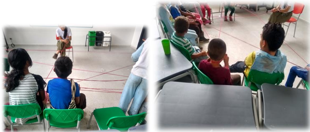
Imagen 1 y 2: Realización del primer Laboratorio colegio de primaria de Chemesquemena fotografías propias del colectivo.

retoma la actividad del trapillo, que ahora consiste en contar momentos no tan agradables. Los niños y las niñas comparten sus experiencias tristes, como la muerte de un ser querido, la pérdida de una mascota o los conflictos familiares. Esta actividad fue fundamental para romper el silencio y mostrar que la vida está compuesta tanto de momentos hermosos como de otros más difíciles, con sus inevitables altibajos. Para cerrar la actividad del trapillo, se compartieron palabras de aliento, recordando que, a pesar de los momentos difíciles, la vida siempre tiene la capacidad de pintarnos esos días grises con colores vibrantes.