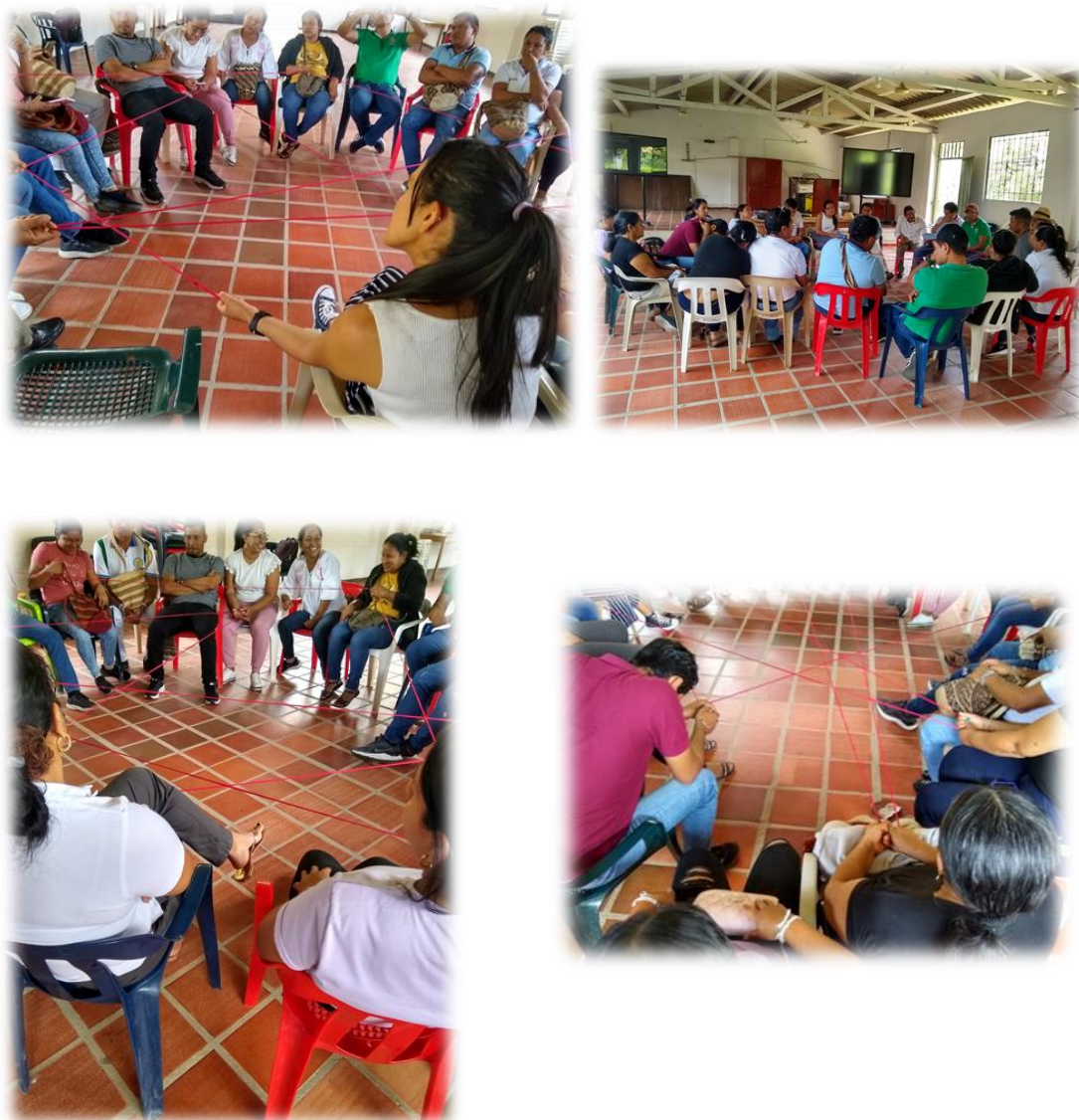
Imagen 9,10,11 y 12: actividad de la araña con el “trapillo” con los docentes en el Colegio de Guatapurí.

Para concluir con la tercera parte del laboratorio, se llevó a cabo la creación de la segunda pieza museal, diseñada por los docentes de Guatapurí sede de Bachillerato y Chemesquemena sede de primaria. En esta actividad, se hizo entrega de un vestido blanco a las mujeres y una camisa blanca para los hombres. Esta elección fue resultado de una decisión unánime de los participantes, aunque en el caso de los hombres no se incluyó el pantalón debido al tiempo limitado que tenían para trabajar en la actividad.