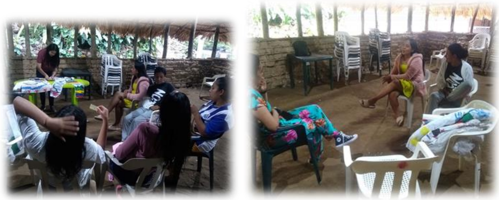
Imagen 20 y 21: encuentro de las jóvenes de la comunidad de Chemesquemena en la casa de pensamiento

Durante el desarrollo del último momento, se llevó a cabo la actividad de la telaraña, una herramienta diseñada para entretjer historias y construir una red de escucha entre las jóvenes. Esta herramienta no solo facilitó que las jóvenes se expresaran de manera más fluida, sino que también fortaleció la confianza al compartir sus vivencias en un espacio seguro.