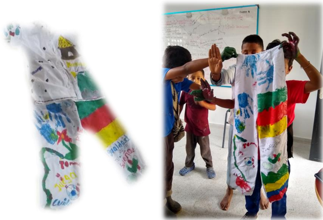
Imagen 3 y 4: resultado de la pieza hecha por los niños del Colegio sede primaria de Chemesquemena.