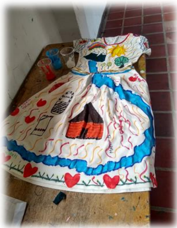
Imagen 18: creación de piezas museales (vestido) por las docentes (mujeres).

También se pintó un arcoíris, símbolo de renacimiento y esperanza, que transmite la idea de aprender de las experiencias difíciles y valorar las lecciones que nos brinda la vida y el territorio. Este detalle refleja la importancia del crecimiento continuo, tanto a nivel personal como comunitario, mediante el aprendizaje no solo de uno mismo, sino también de los demás. Otro elemento que se destacó fue los corazones, que simbolizan el amor propio y el amor colectivo.