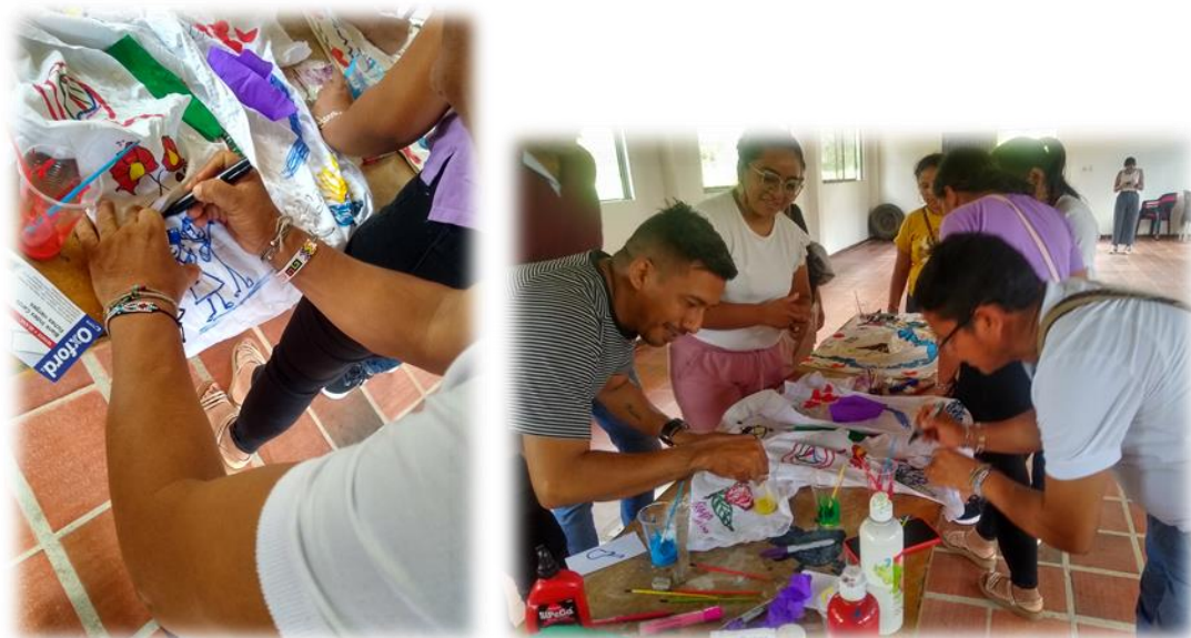
Imagen 13, 14, 15 y 16: Proceso de elaboración de piezas museales, con los docentes en el Colegio de Guatapurí