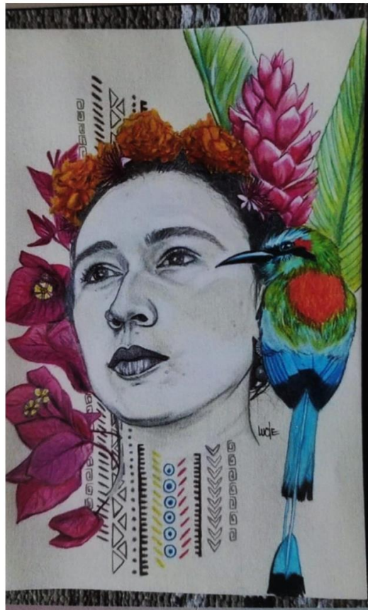
Figura 3. "Ale" - Realizado por Lucie in the sky with diamonds