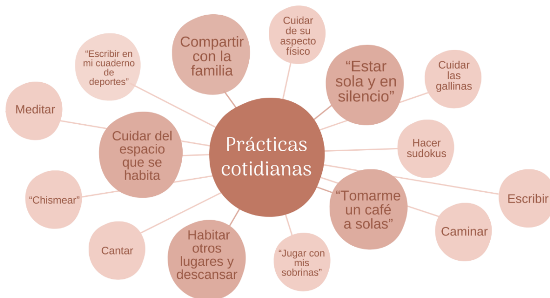
Figura 7. Elaboración propia

Estas acciones, en su aparente simplicidad, encierran un significado más profundo, son acciones que hacen fisura dentro de la cotidianidad de las mujeres rurales y campesinas, representando formas de resistencia ante las condiciones adversas.