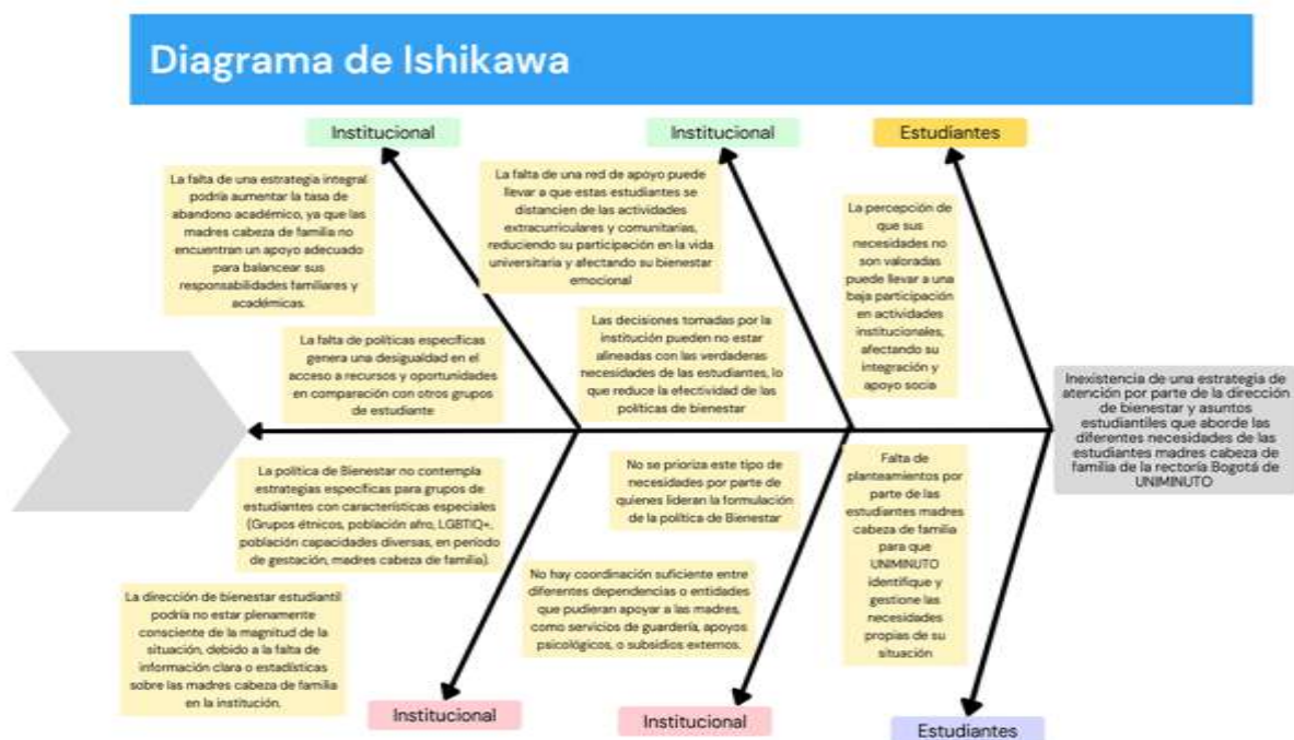
Diagrama de Ishikawa