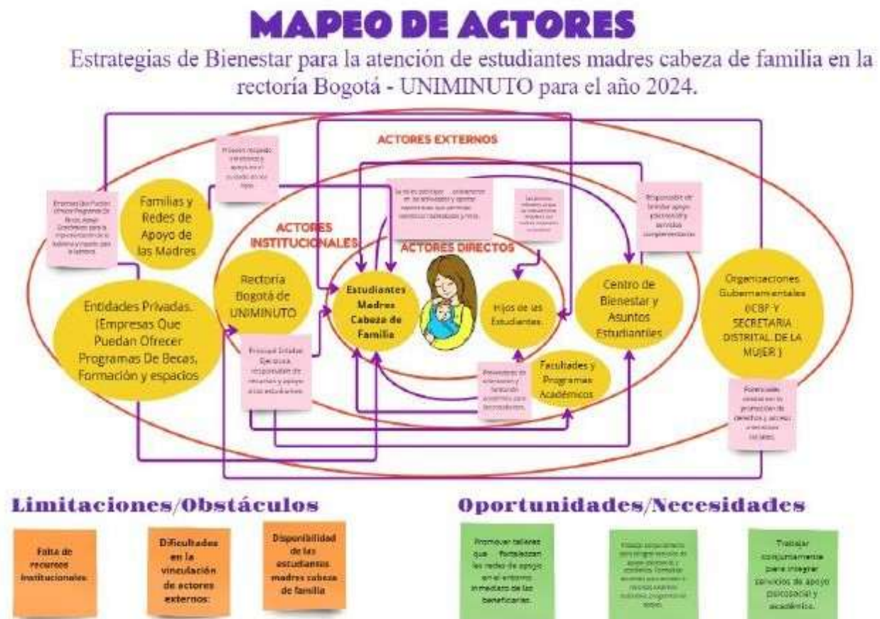
Figura 2. Elaboración propia