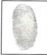
Huella dactilar física

CC N° 40.049.134 GINNA PAOLA MOYANO MESA