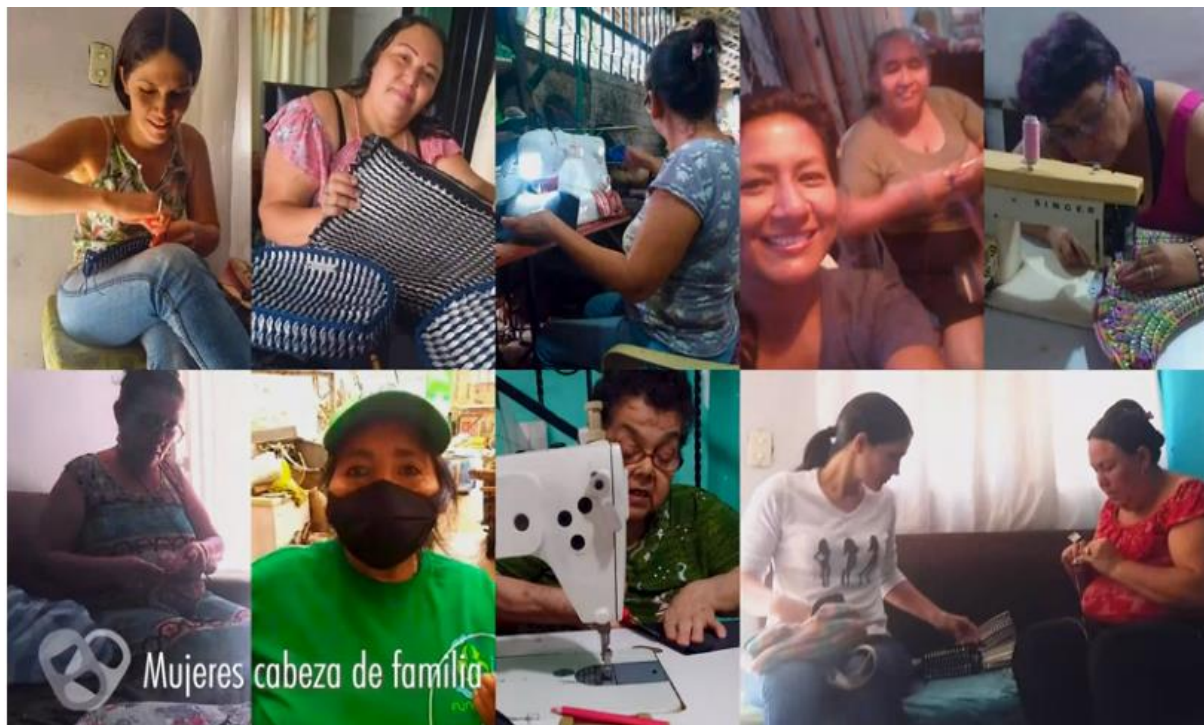
Figura 1. Trabajadoras de Shakti Moda Consciente