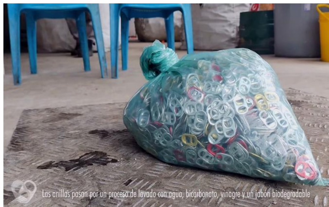
Figura 4. Insumos y materialización de cartera Shakti Moda Consciente