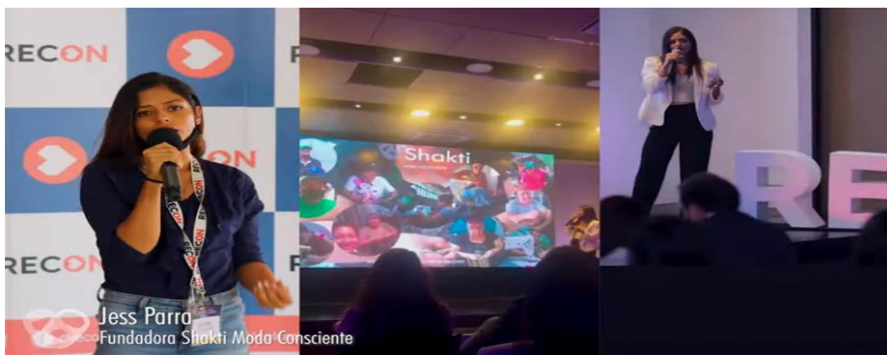
Figura 8. Experiencias de emprendimiento con desarrollo sostenible de Shakti Moda Consciente