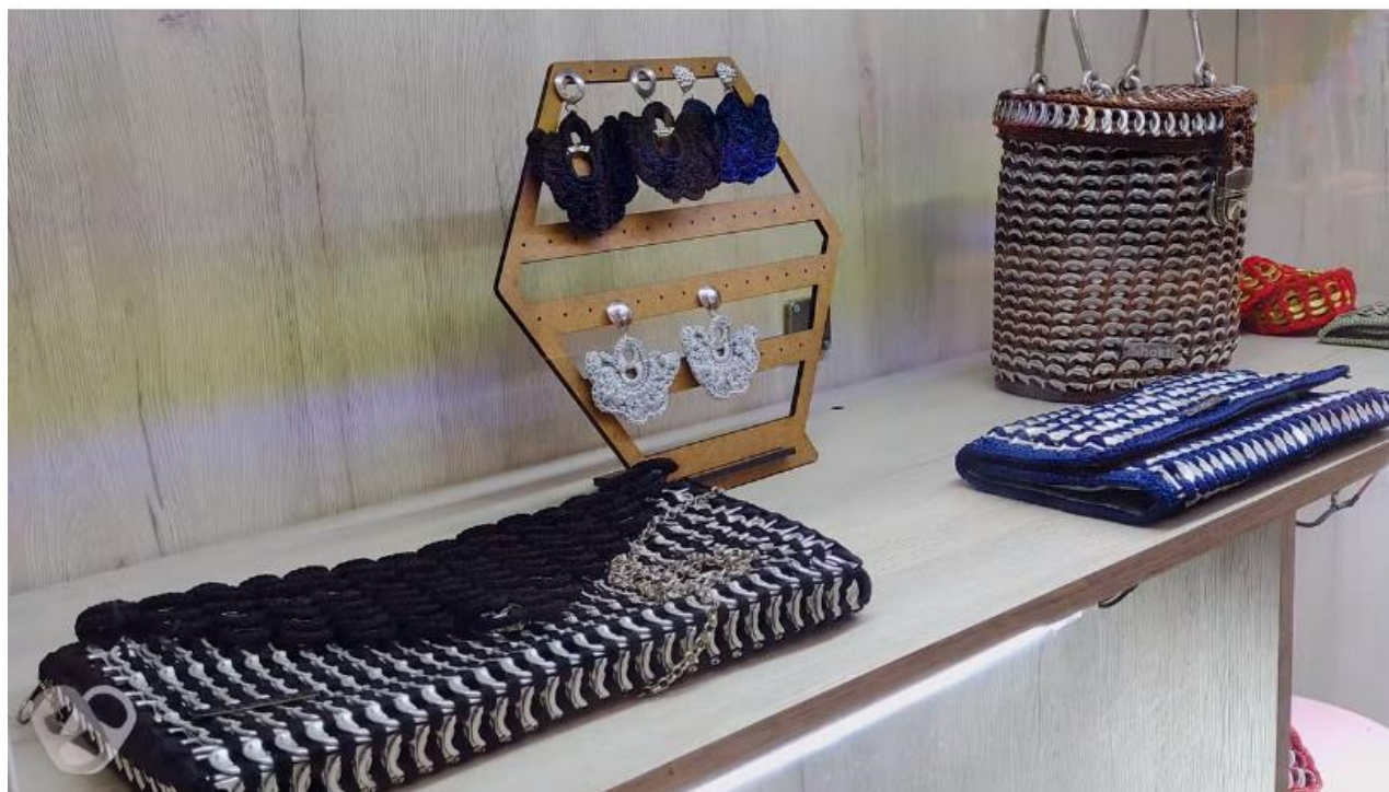
Figura 7. Accesorios de Shakti Moda Consciente