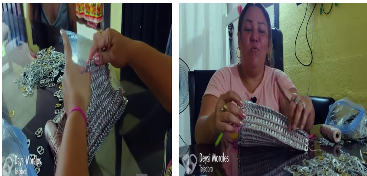
Figura 2. Proceso de elaboración del bolso con anillas de latas de cerveza.