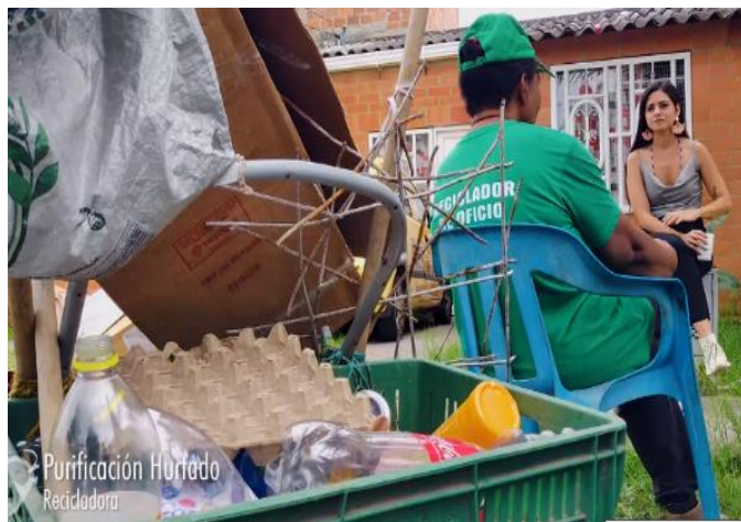
Figura 5. Entrevistas y conversaciones con las trabajadoras de Shakti Moda Consciente