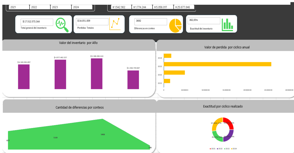
Dashboard Inventario últimos 4 años Tropi.

Nota. La imagen muestra los datos en pérdidas arrojados en los últimos cuatro años en los inventarios del grupo Tropi.