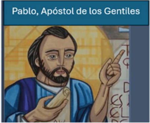
Pablo, Apóstol de los Gentiles