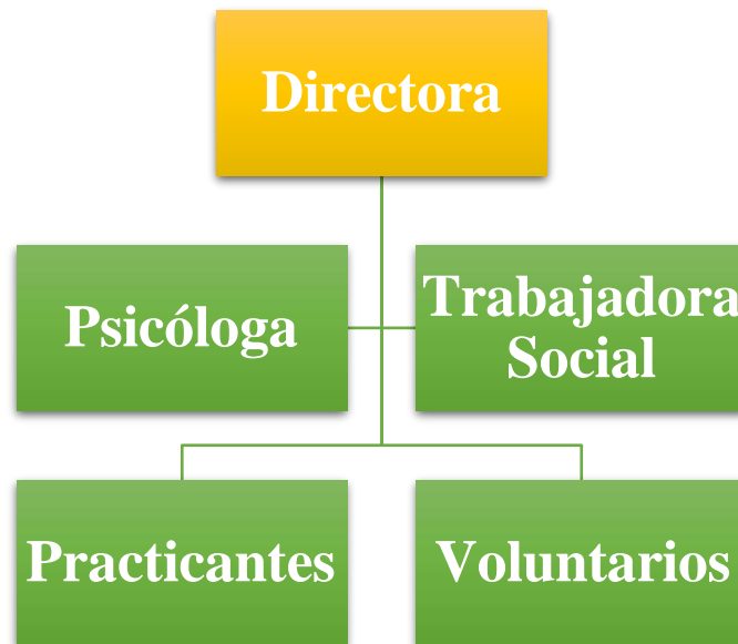
Figura 1 Organigrama de la Fundación Madres Solteras de Colombia

Aunado a esto, la directora explicó en la conversación que, en el presente año la fundación cuenta con tres empleadas directas, quienes son ella como directora de la fundación, una psicóloga y una trabajadora social, (Figura 1). Además, hacen parte también algunos empleados indirectos, que se desempeñan como voluntarios y practicantes.