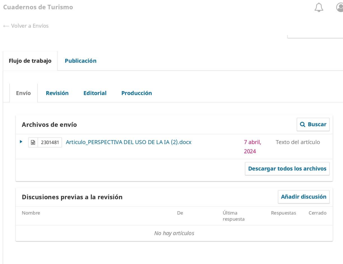
Figura 3. Proceso de sometimiento artículo científico.