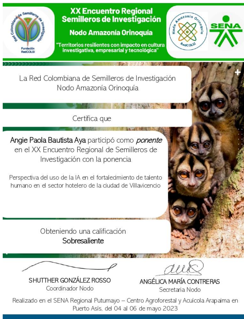
Figura 1. Certificado participación ponente en el XX encuentro regional de Semilleros de Investigación.

Adicionalmente, se realizó la presentación en el XII encuentro regional de semilleros de investigación R.O 2023-2 con la universidad UNIMINUTO donde se obtuvo una calificación de 70,5 sobre 100 puntos posibles, además de una retroalimentación enriquecedora.