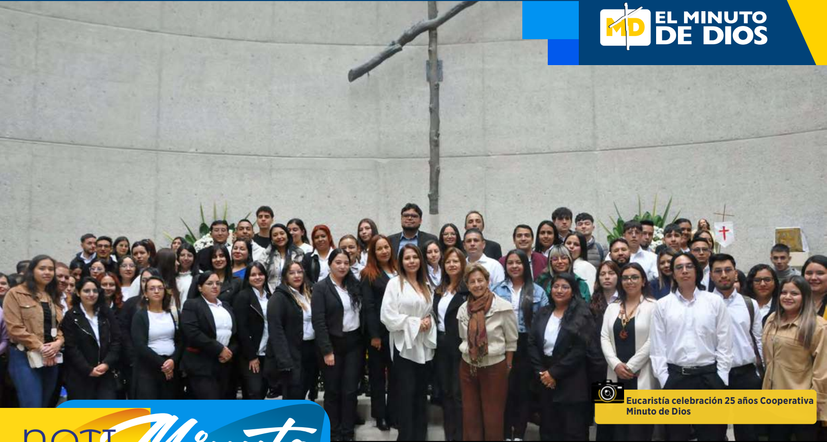
Eucaristía celebración 25 años Cooperativa Minuto de Dios