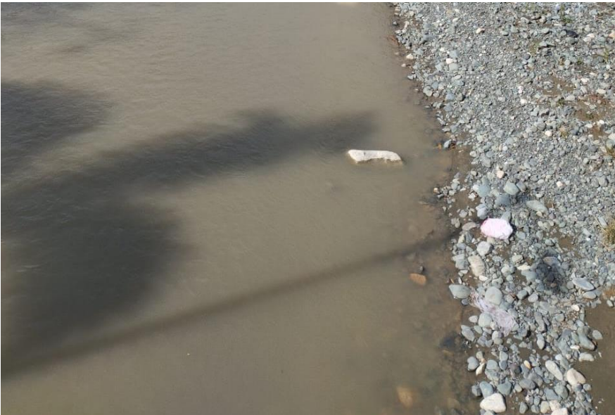
Condiciones del río Tuluá

Nota: Imagen que detalla las condiciones del río Tuluá.