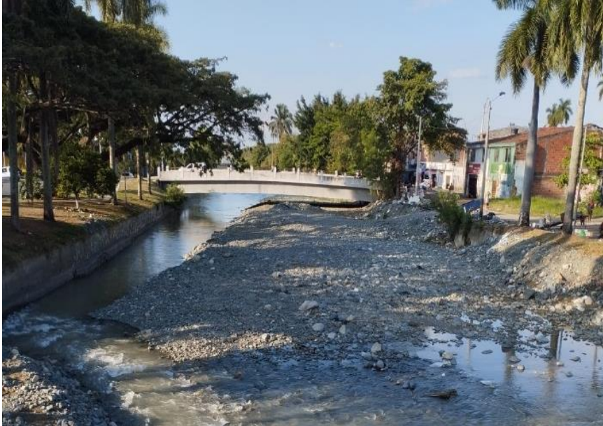
Condiciones del río Tuluá

Nota: Imagen que detalla las condiciones del río Tuluá.