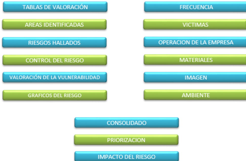
Flujograma 1. Análisis de vulnerabilidad

Mayo a Junio: se socializo el plan de prevención, preparación y respuesta ante emergencias para todo el personal de la empresa cumpliendo con las actividades del SGSST, se repartieron roles y responsabilidades y se socializo con el comité paritario de seguridad de seguridad y salud en el trabajo.