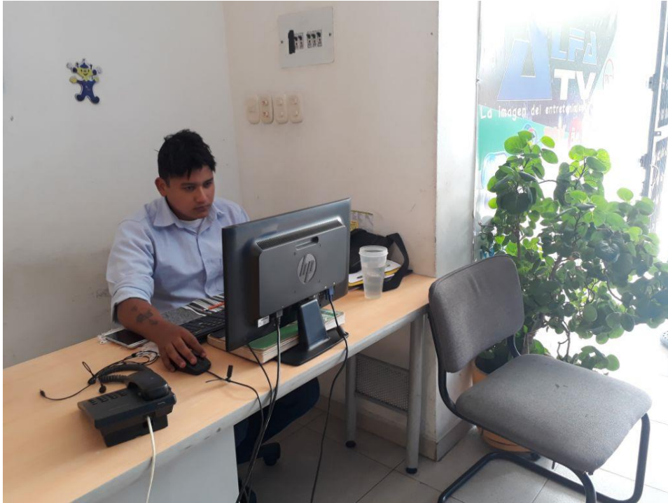
Registro Fotográfico 3.