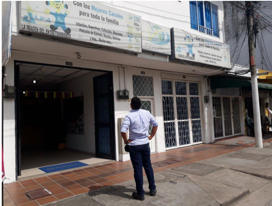
Registro Fotográfico 5.