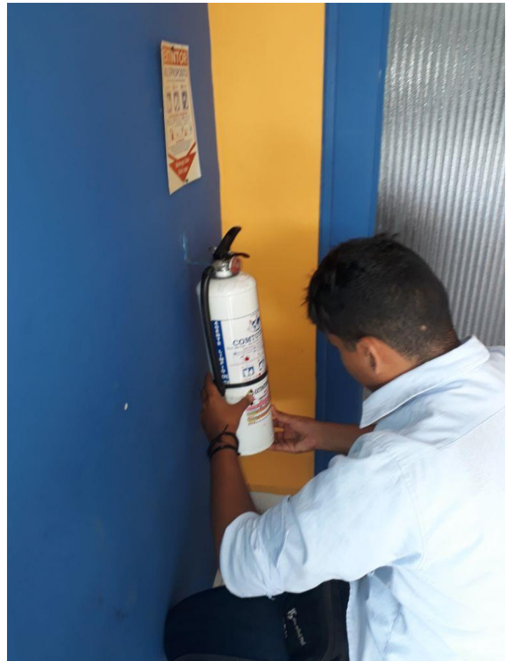
Registro Fotográfico 4.