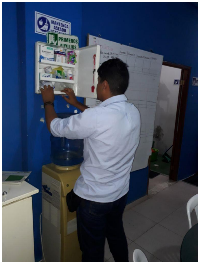
Registro Fotográfico 6.