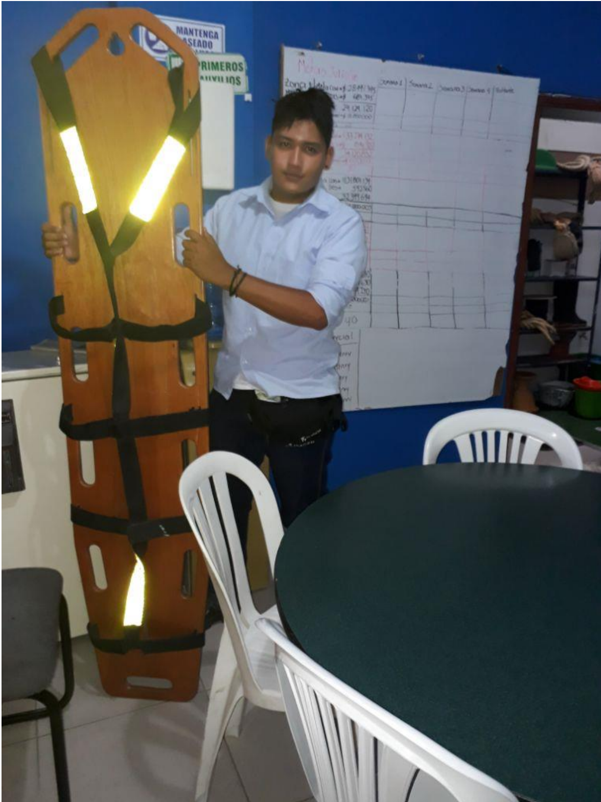
Registro Fotográfico 7.