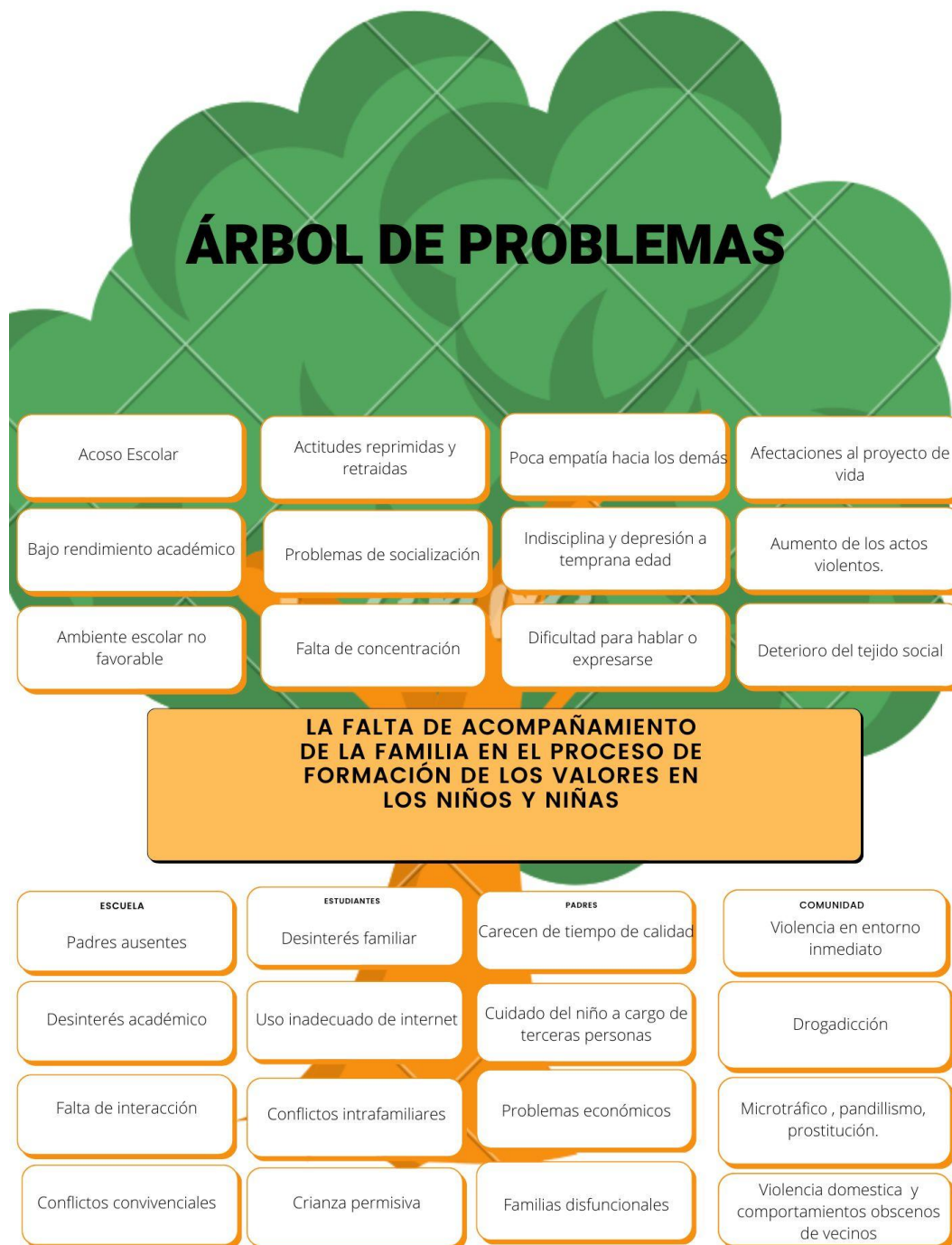
Figura 1 Árbol de problema

Imagen 1. Marín, L. Rivas, F. Ricardo, G. (2022). Elaboración propia. Árbol de problemas: Descripción de las causas directas y de los efectos por la falta de acompañamiento de las familias en los procesos de formación de valores de los niños.