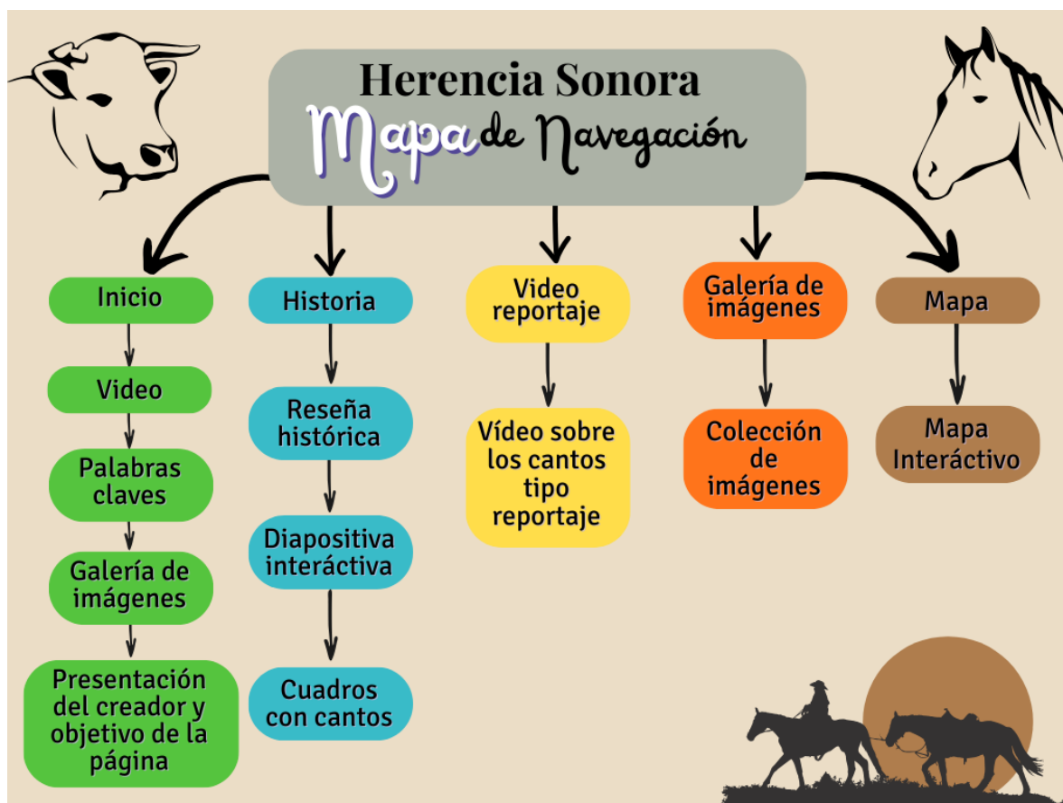
Figuras 2 Gráfico de Sistema de Navegación