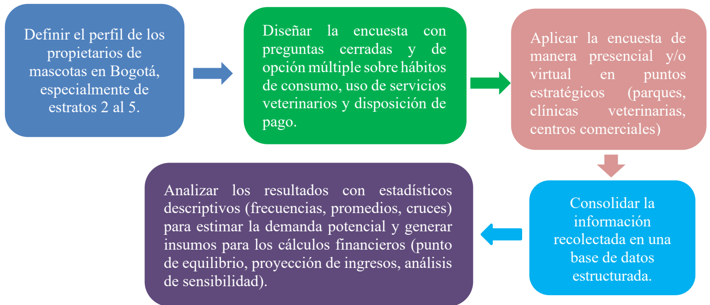
Figura 1. Flujograma de la encuesta