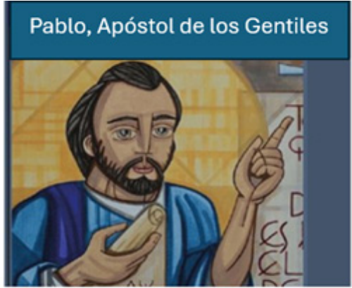
Pablo, Apóstol de los Gentiles