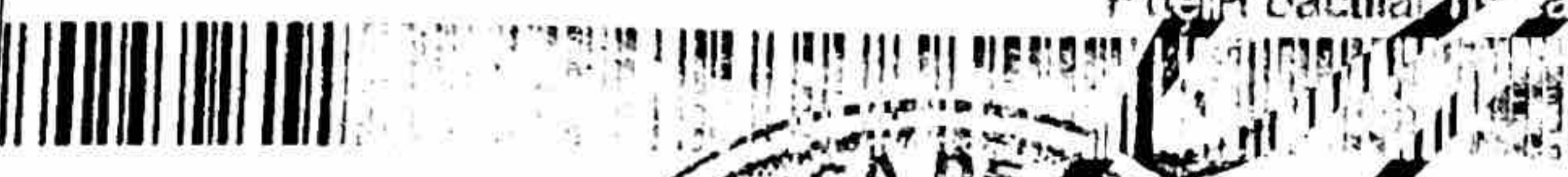
Huella dactilar (Índice)

CC N° 1.070.970.348 JENNIFER TATIANA LEON PEÑA