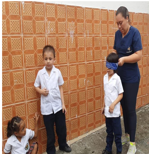
Imagen 2 Actividad BUSQUEDA EN LA CIUDAD