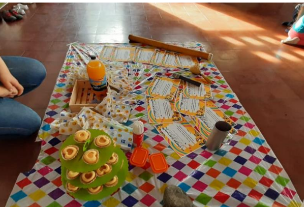
Imagen 7 Actividad de clausura PICNIC LITERARIO