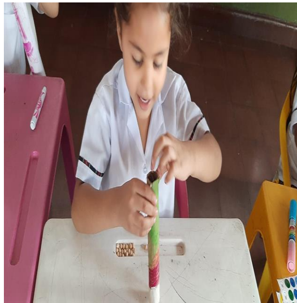
Imagen 3 Actividad AL RITMO DE TU FAMILIA