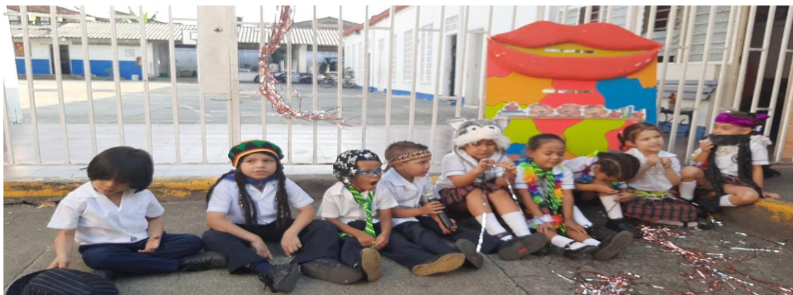
Imagen 4 Actividad HOY CANTO YO