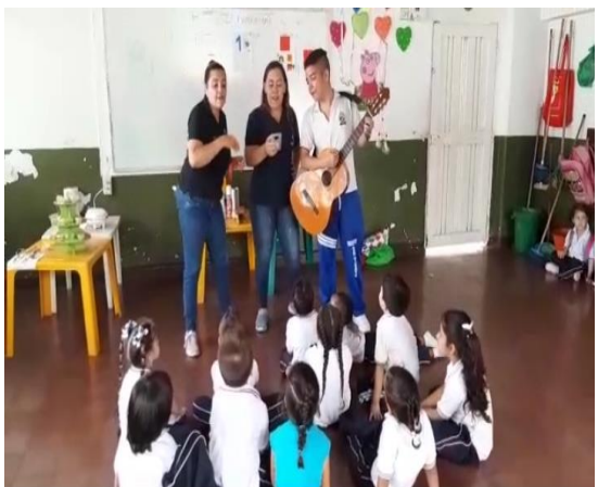
Imagen 8 Actividad de clausura PICNIC LITERARIO