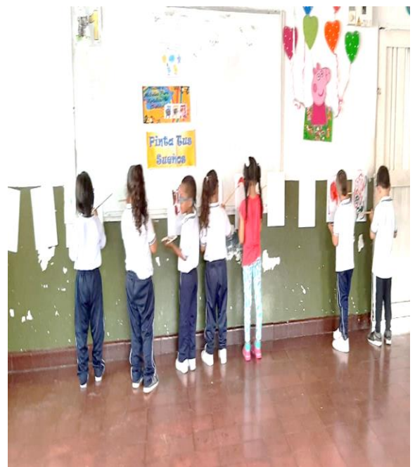
Imagen 1 Actividad de caracterización NOTICIERO PINTA TUS SUEÑOS