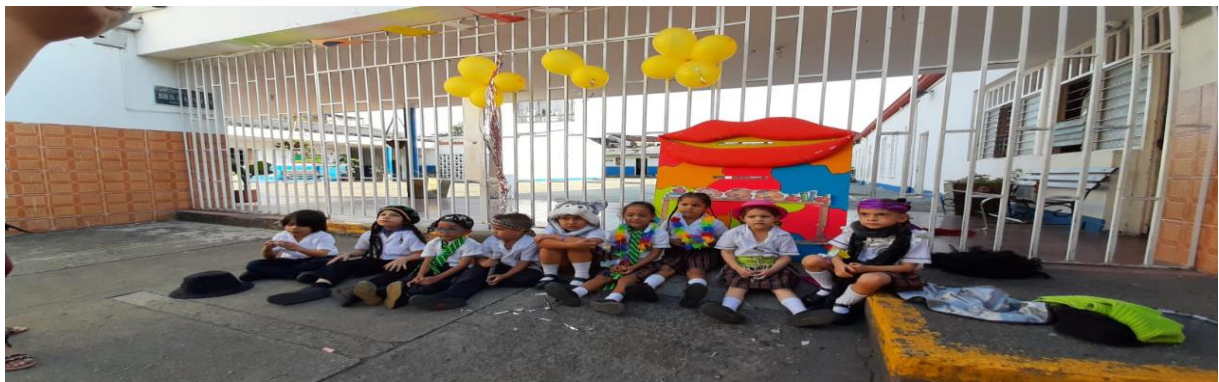
Imagen 5 Actividad HOY CANTO YO