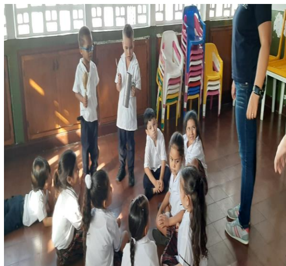
Imagen 6 Actividad CANTA Y MUEVETE