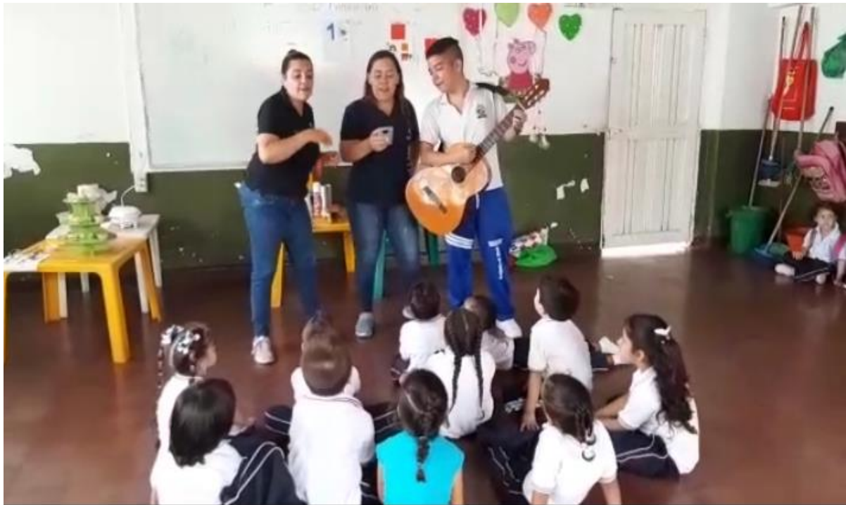
Imagen 9 Actividad de clausura PICNIC LITERARIO