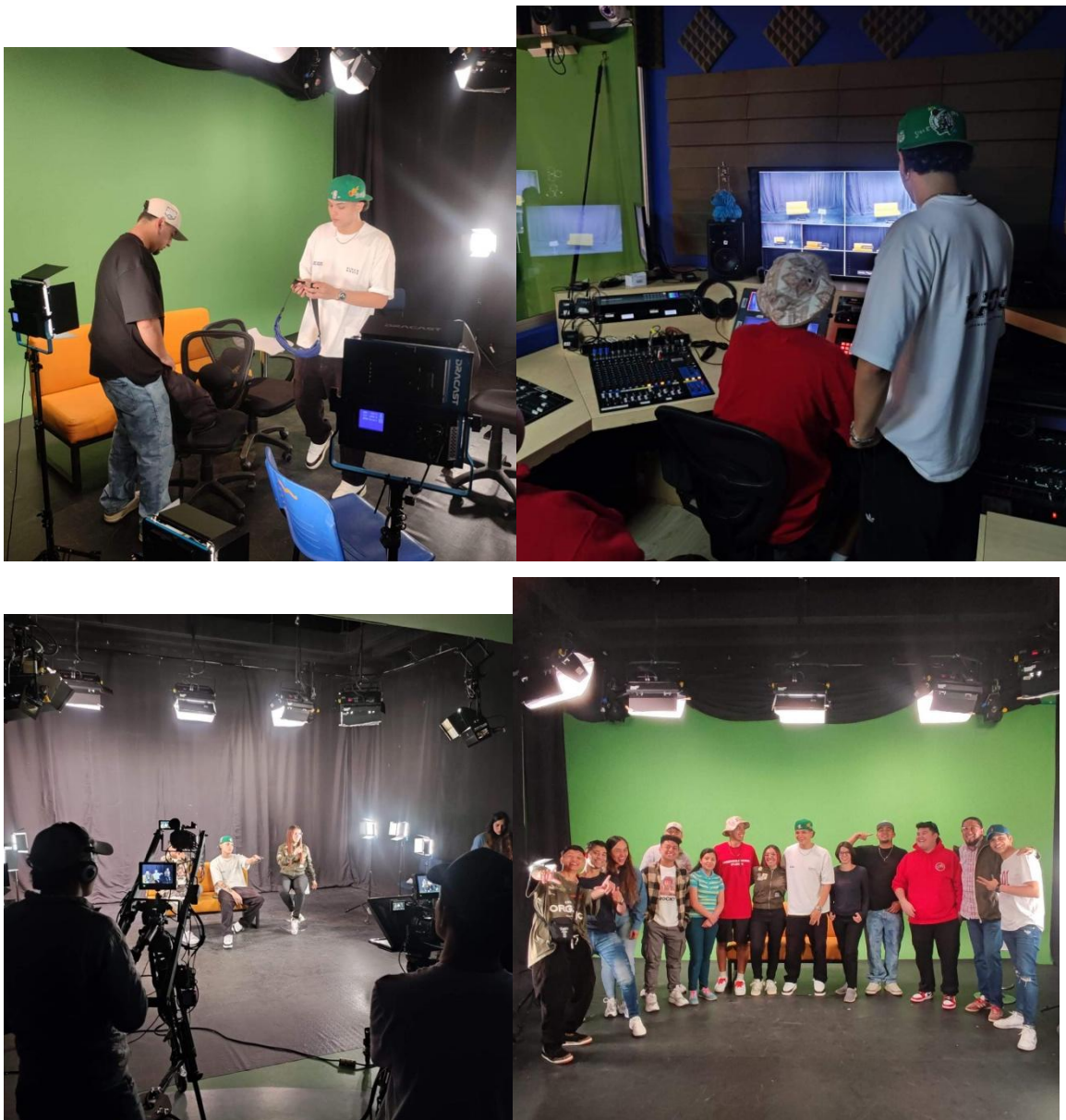
Practica de programa piloto y elección de presentadores en el CRAI UNIMINUTO

En este espacio se llevó a cabo el primer dialogo y practica de cómo se grabaría SoniVersos y cuál sería su objetivo principal junto a los artistas.