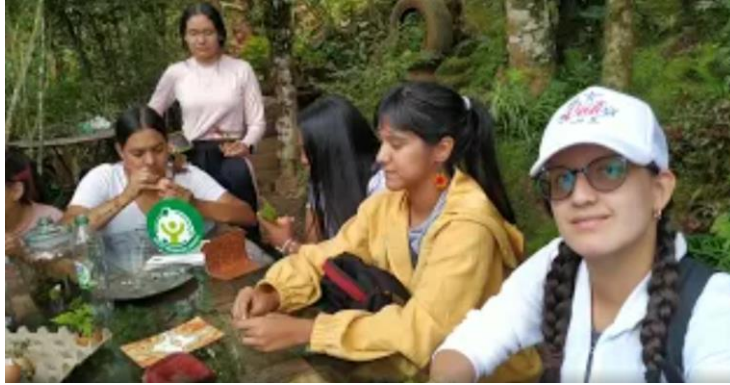
Figura #1 Vídeo salida pedagógica