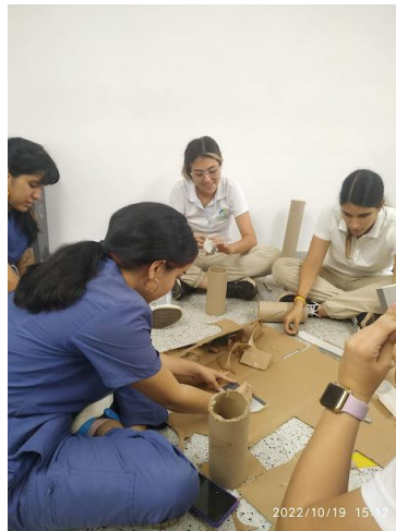
Imagen #5 Foto tomada en el salón de clases USB Cali de propia autoría

Cuando hablamos muchas veces de laboratorio, pensamos en cosas muy sofisticadas como elementos que pertenecen casi que a la NASA, sin embargo los laboratorios que se plantearon aquí tuvieron bajos costos, todo estaba enfocado en el deseo de construir experiencias significativas y que tuvieran un alto grado de emociones como la alegría, a veces era tan intenso todo aquello que descubran que no se escatimaron las lágrimas que se desbordaba por emociones encontradas, por preguntas a las que nunca daremos respuesta como ¿Por qué no aprendí así? Si mi maestro hubiera hecho al menos una sola “cosa” de las que hemos realizado en este curso, mi vida dentro de la escuela hubiese sido otra y más en esta asignatura. Humanizar el aprendizaje y el aprendizaje matemático es imperante, sabemos cómo docentes o agentes educativos que cuando las emociones como la alegría, alegría de descubrir de no tener miedo a la respuesta incorrecta producen en nuestros estudiantes aprendizajes que perduraran para toda la vida, y no solo para el examen.