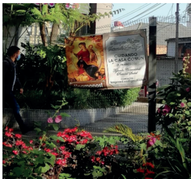
Tomado de : El Catolicismo, 09 de Marzo de 2022

Un ejemplo actual de acción pastoral la encontramos en la Arquidiócesis de Bogotá, que desde el 2022 ha promovido la consolidación de eco-parroquias y el galardón de San Francisco de Asís, inspirados por la encíclica Laudato si' . En este marco, permanece activo el proyecto de la parroquia Nuestra Señora de las Aguas, donde la comunidad parroquial impulsa la recuperación, embellecimiento y mantenimiento de un espacio del Eje Ambiental (El Catolicismo, 2022).