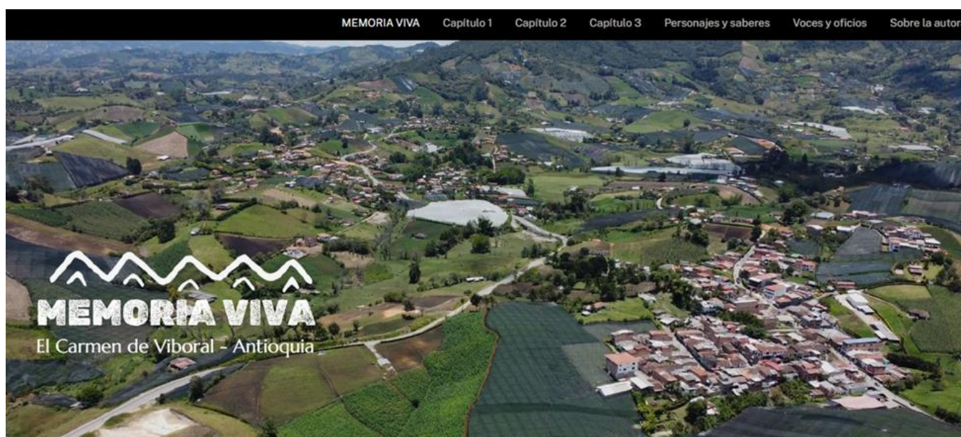
Figura 13: Memoria Viva – página web

https://educacionenplenosigloxxi.my.canva.site/copia-de-miniserie-memoria-viva