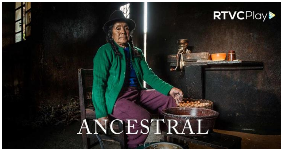
Figura 1: Serie Ancestral – RTVCPlay

https://rtvcplay.co/series-documentales/ancestral/eugenio-maria