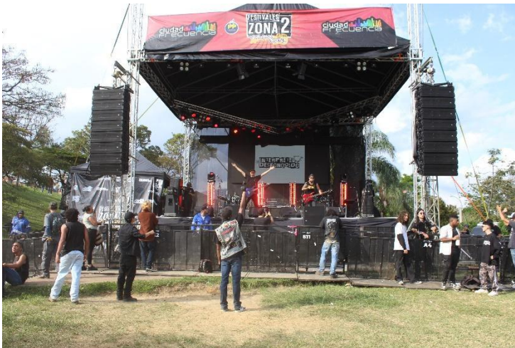
Ilustración 12 Concierto Festival rock zona 2. Elaboración propia