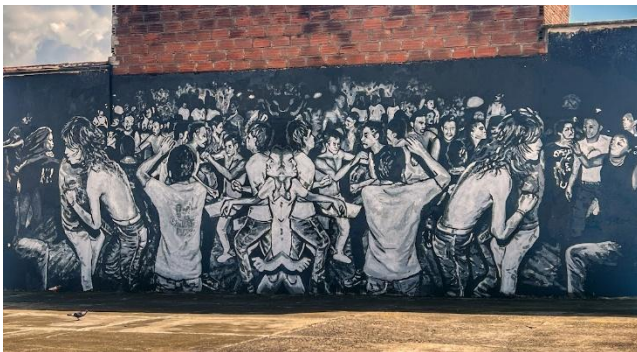
Ilustración 10 Mural Castilla sobre cultura punk. Elaboración propia