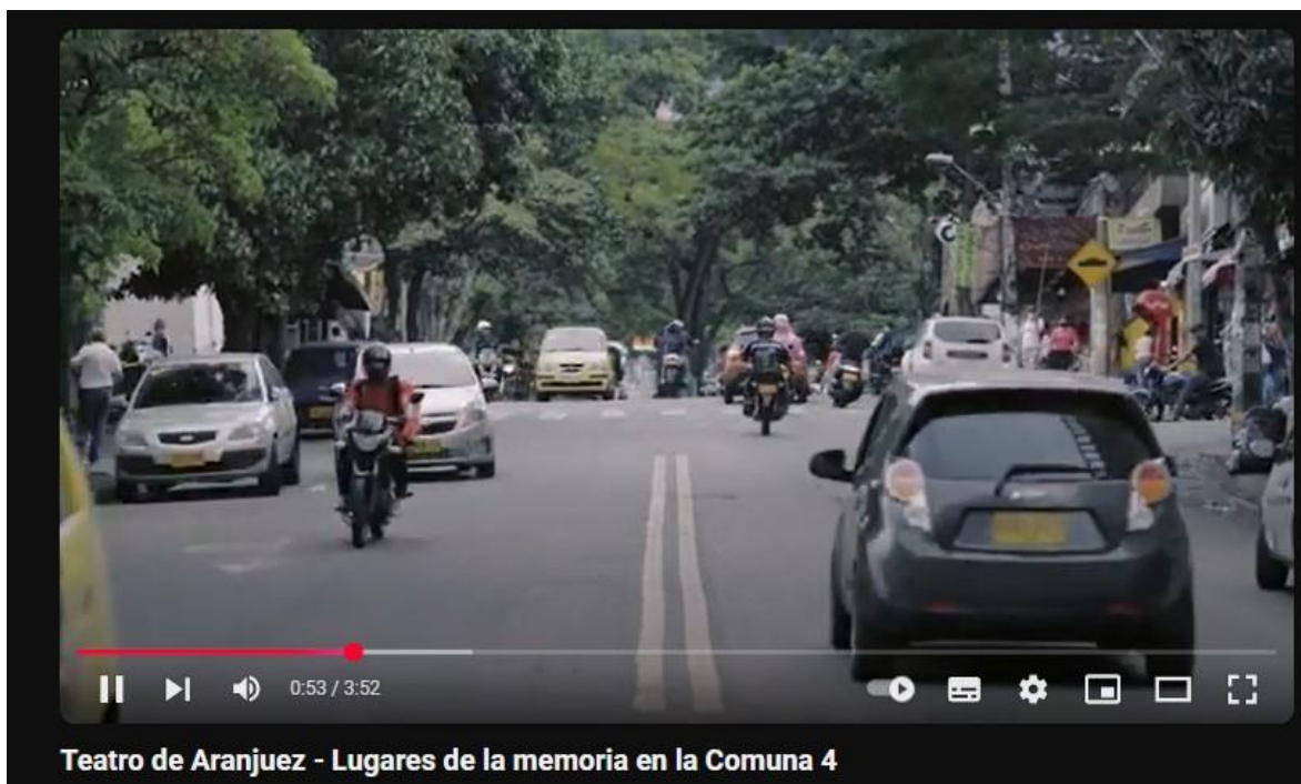
Ilustración 2 Captura pantalla Documental Lugares de memoria comuna 4

https://www.youtube.com/watch?v=lmKHpZdp4Oo&list=PLN-MVvUa9JzS7GJ-zHuVRv2-ST5VjmlBO