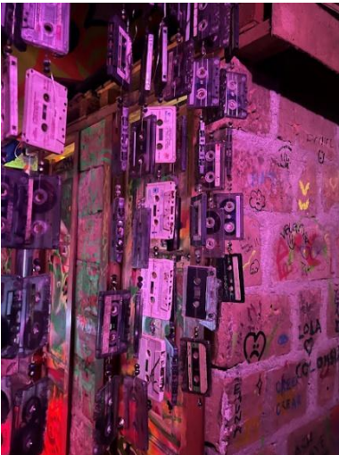
Ilustración 13 Estética punk en Casa de la Luna. Elaboración propia