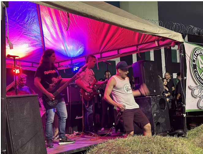
Ilustración 8 Concierto Universidad de Antioquia. Elaboración propia