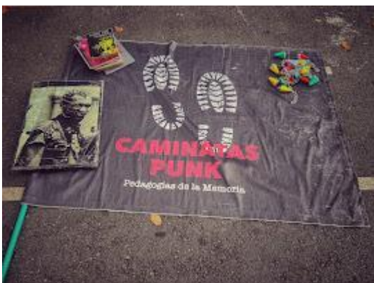
Ilustración 11 Caminata punk castilla. Elaboración propia