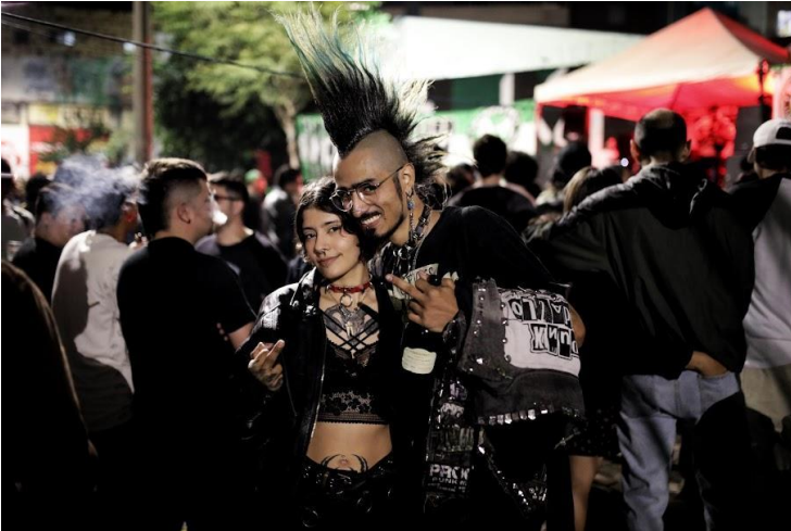
Ilustración 9 Pareja punk en concierto. Elaboración propia