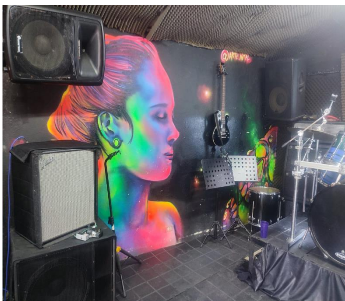
Ilustración 5 Casa Lesmes Sala de Ensayo. Elaboración propia