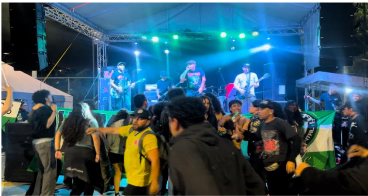
Ilustración 7 Concierto Punk Cancha Jardín Comuna 3. Elaboración propia