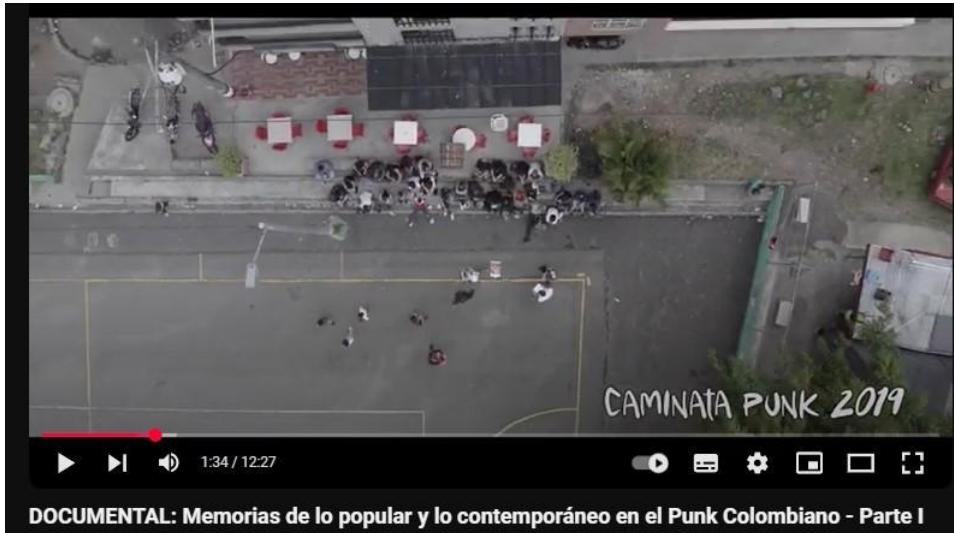
Ilustración 1 Captura pantalla Documental Memorias de lo popular y lo contemporáneo en el punk colombiano https://www.youtube.com/watch?v=tOgVt_gaMMs