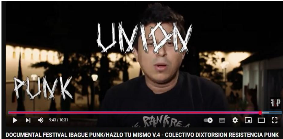
Ilustración 4 Captura Pantalla Documental festival Ibagué punk/ hazlo tú mismo

https://www.youtube.com/watch?v=rTlzHJRcKXQ