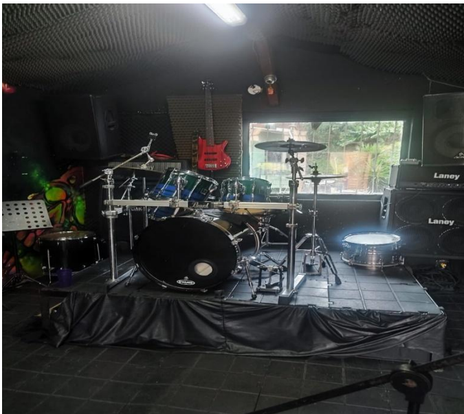
Ilustración 6 Casa Lesmes Sala de ensayo. Elaboración propia