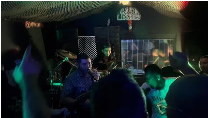
Ilustración 14 Reunión Casa Lesmes. Elaboración propia