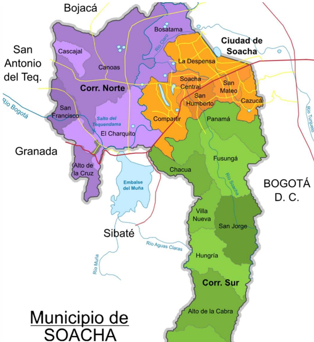
Mapa Municipio de Soacha (2019)

La independencia municipal en el manejo de sus recursos tiene sus cosas buenas y no tan buenas. Lo menciona Sarmiento (2020) “La tendencia de los servidores públicos a no cuidar como propios los bienes y recursos del municipio lleva al despilfarro y grandes pérdidas”.