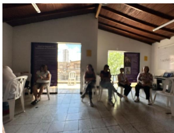
Participación en la charla sobre prevención del suicidio en la Secretaría de las Mujeres de Bello, Antioquia.