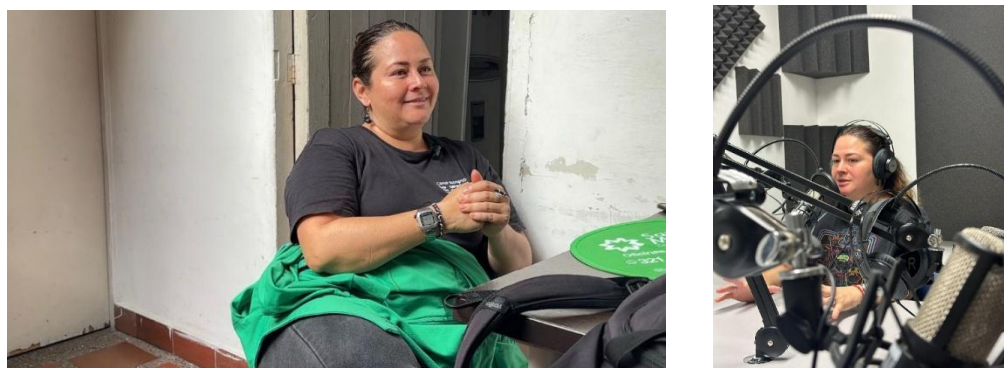
Entrevista con una de las profesionales especialistas de la Secretaría de las Mujeres de Bello, Antioquia.