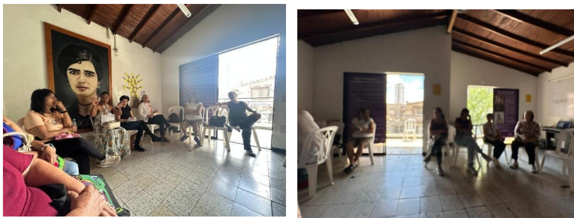
Participación en la charla sobre prevención del suicidio en la Secretaría de las Mujeres de Bello, Antioquia.