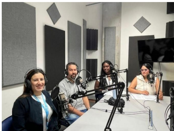
Grabación del podcast con la secretaria de Despacho y el psicólogo de la Secretaría de las Mujeres, producto final del trabajo de grado.