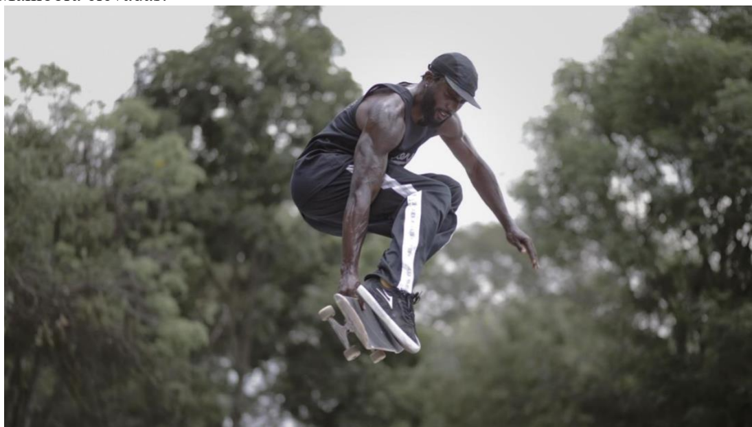
Figura 8 Maniobra elevadas.

Nota: Maniobra de grab sobre el puente de la 4sur. (Elaboración propia).