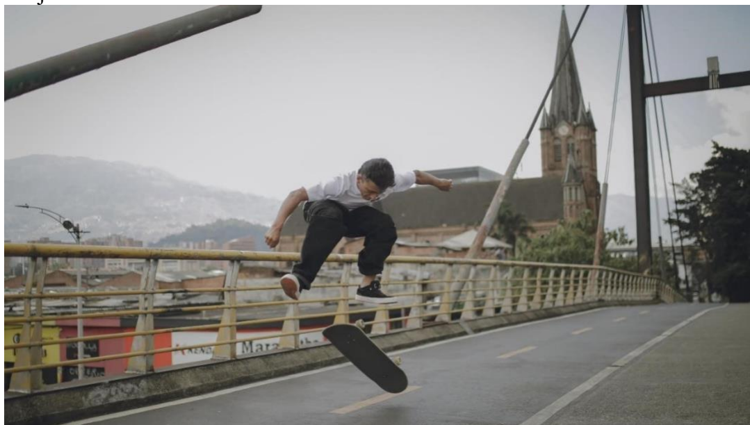
Figura 6 Trucos callejeros.

Nota. Ejecución de kickflip en el entorno urbano. (Elaboración propia).