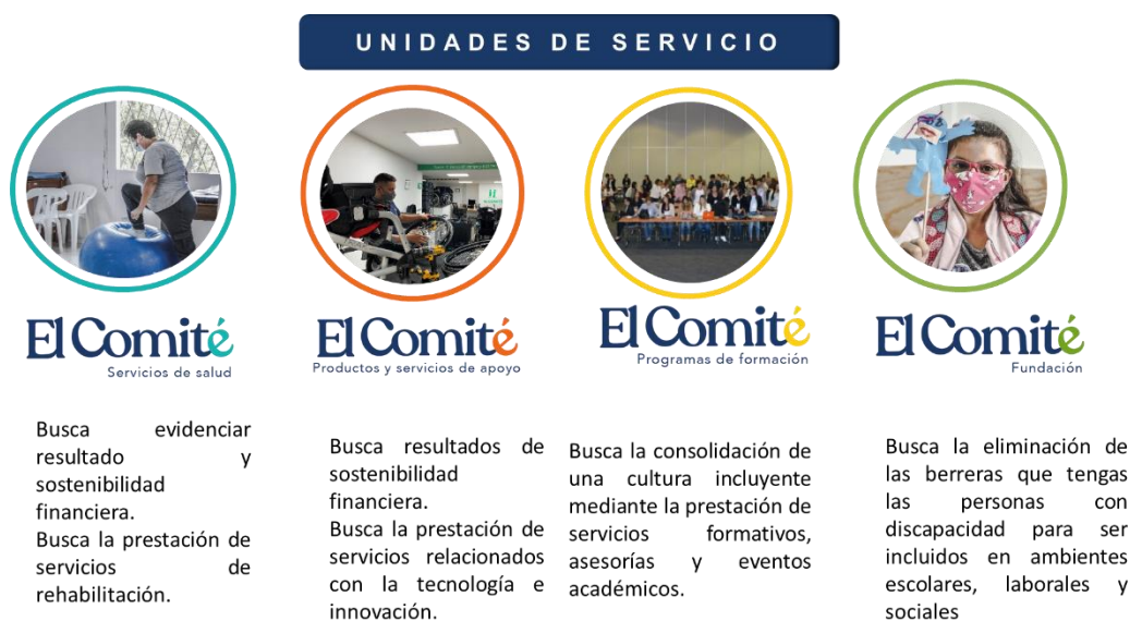
Figura 3. Unidades de Servicio actuales de El Comité