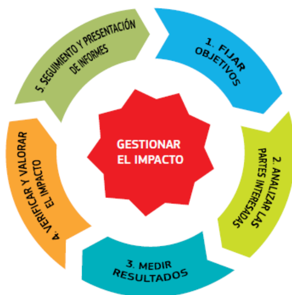
Figura 6. Gestión del Impacto