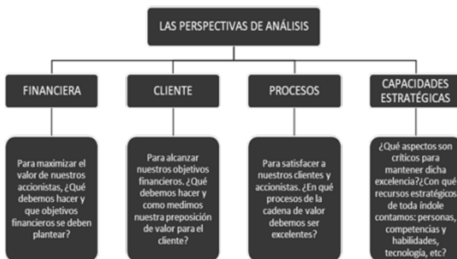
Figura 4. Perspectivas de Cuadro de Mando Integral