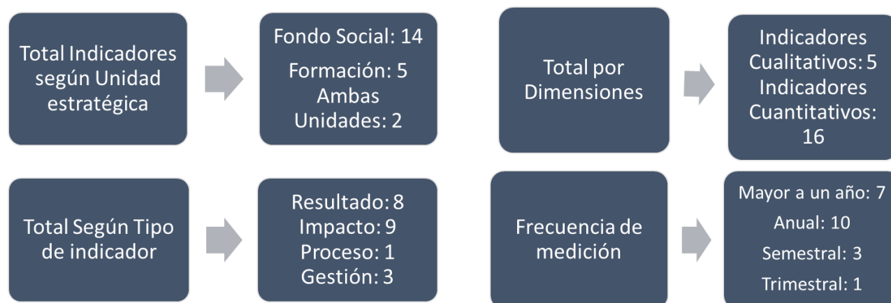
Figura 5. Clasificación General de los Indicadores

Nota: Consolidación de cuadro de indicadores validado por los actores estratégicos convocados para este ejercicio investigativo.