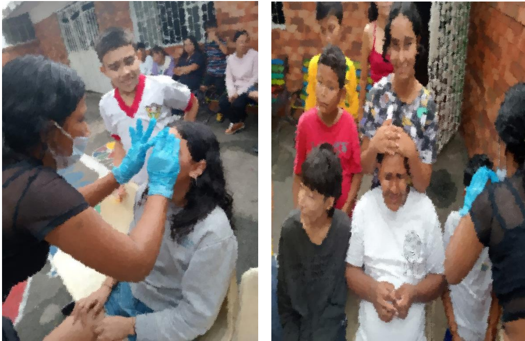
Ilustración 9. Actividad 4 - Spa Facial