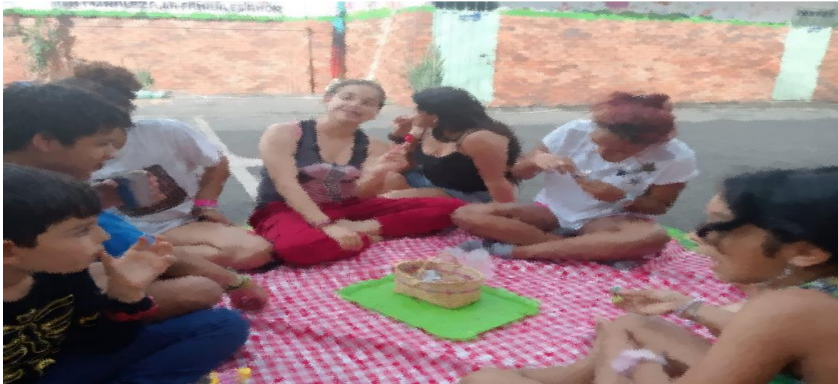
Ilustración 7. Actividad 2 - Juego de Roles

Como consecuencia de la actividad anterior, el Helado Didáctico se convirtió en escenario para poner a prueba las observaciones cualitativas obtenidas en el discurso de los estudiantes. Por eso, el juego de roles no sólo funcionó para medir habilidades de organización y planeación, sino también, para extraer información de las conductas manifiestas en esta población en medio de tareas complejas como las que se plantearon.