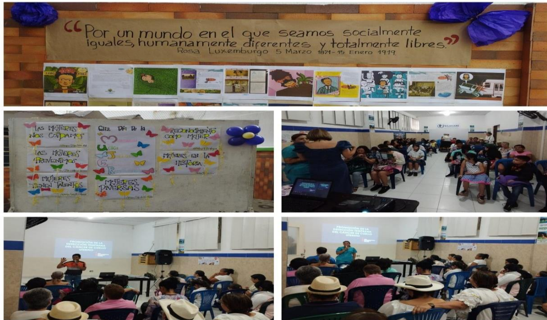
Ilustración 4. Cartografía de la página web de la fundación Laical Miani FULMIANI Bucaramanga Santander