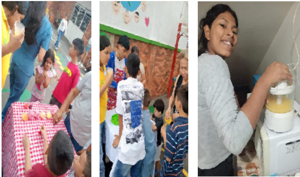
Ilustración 10. Actividad 4 - Helados Artesanales/Naranjada/Preparación