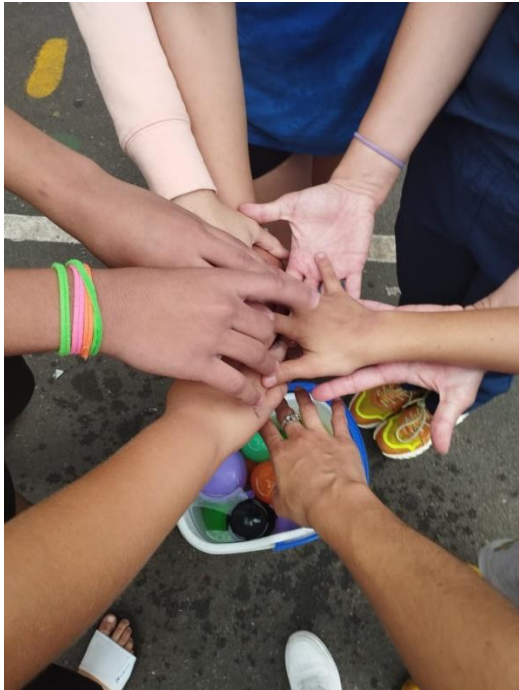
Ilustración 11. Actividad 4 - Socialización