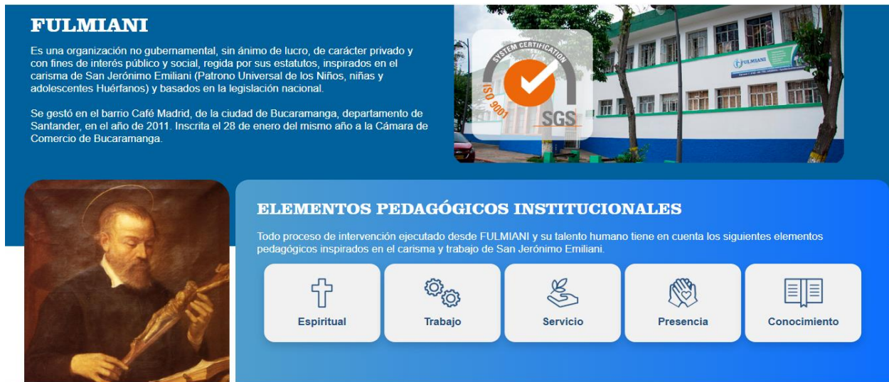
Ilustración 2. Cartografía de la página de la fundación Laical Miani FULMIANI Bucaramanga Santander