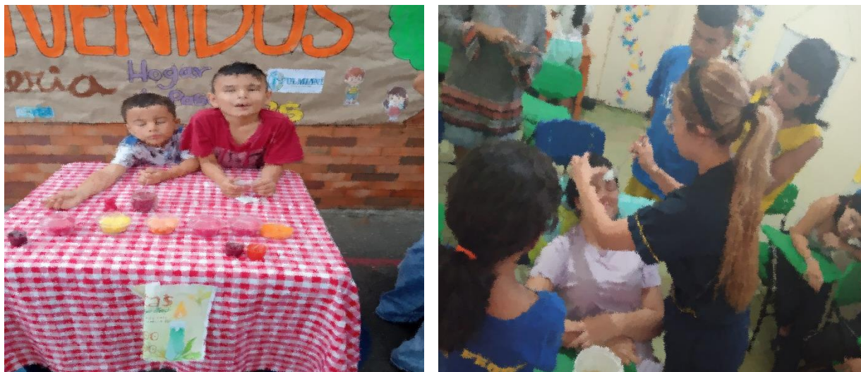
Ilustración 8. Actividad 3 - Helados Artesanales/Spa Facial

De esta manera, la preparación de helados artesanales y productos para el tratamiento de la piel se convirtieron en los escenarios más provechosos para el desempeño de los estudiantes, tal como se muestra en las siguientes imagines.