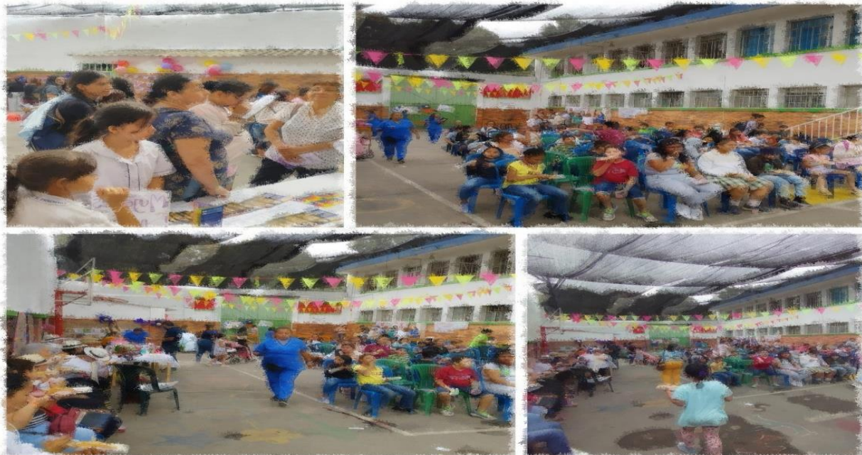
Ilustración 3. Cartografía de la página web de la fundación Laical Miani FULMIANI Bucaramanga Santander