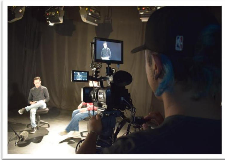
Cámara 3 con enfoque e invitado