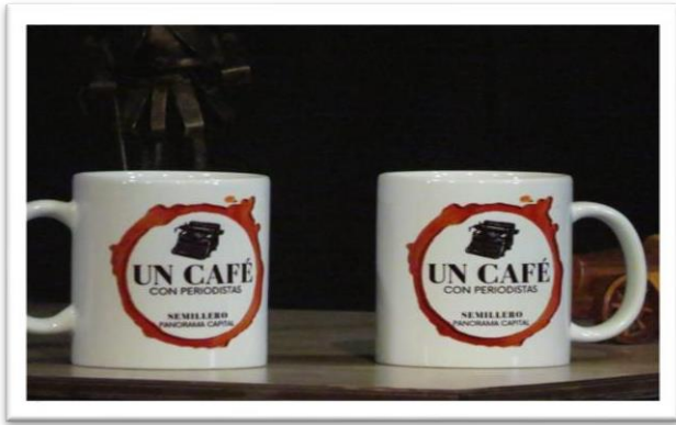
Pocillos de Café con Periodistas