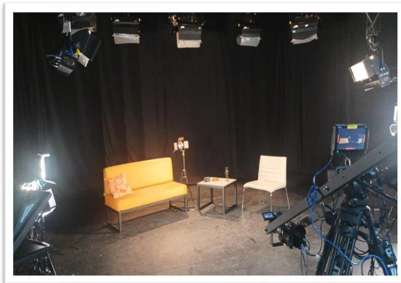
Construcción sed de grabación "Café con periodistas"2023

Para la grabación de los dos capítulos se utilizó el estudio de televisión de la Corporación Universitaria Minuto de Dios en su sede principal en la calle 80 de la ciudad de Bogotá, se realizó el set con un fondo negro total para dar la sensación de que efectivamente todo se estaba desarrollando en un estudio, para los invitados hicimos uso de un sofá naranja con bastante espacio pensando en la comodidad de quien fuera entrevistado, para nuestro compañero que iba a desarrollar la entrevista utilizamos una silla beige, detrás de todo hay una cámara de decoración, en el medio de los dos asientos dispusimos de una mesa de centro la cual traía encima de ella una cámara y objetos de decoración, también ahí mismo es donde ponemos nuestro sello de identidad el cual son dos pocillos de café con periodistas donde nuestros protagonistas disfrutaron de un gran café sintiéndose en casa y no está de más mencionar que se hizo uso de todos los equipos profesionales con los cuales cuenta el estudio de tv de Uniminuto.