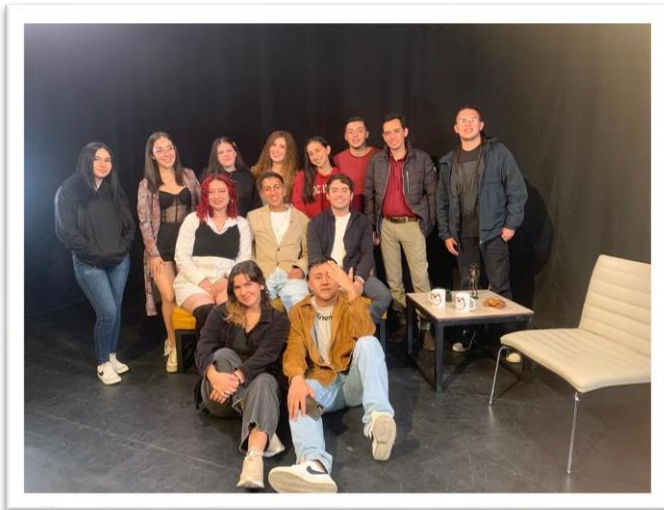
Equipo de producción para el capítulo: Un café con Julián Triana