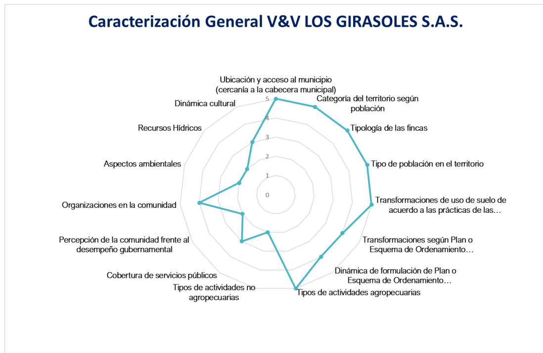
Figura 1 Gráfico Radial Caracterización general de V&V LOS GIRASOLES S.A.S. en su contexto rural