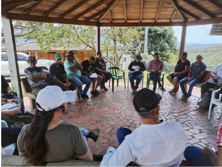
Imagen 4. Reuniones de planeación COMDERPAZ.

contrato de arrendamiento entre las familias firmantes y la Sociedad de Activos Especiales SAE, bajo requisito de ser representados por una organización de economía solidaria y lo hicieron a través de la Corporación Para La Paz y El Desarrollo Alternativo, COPAZ.