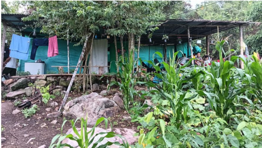
Imagen 3. Viviendas de los excombatientes.

en su mayoría las familias de los excombatientes son muy humildes, mientras otros decidieron seguir viviendo en la ciudad de Cúcuta y su Área Metropolitana.